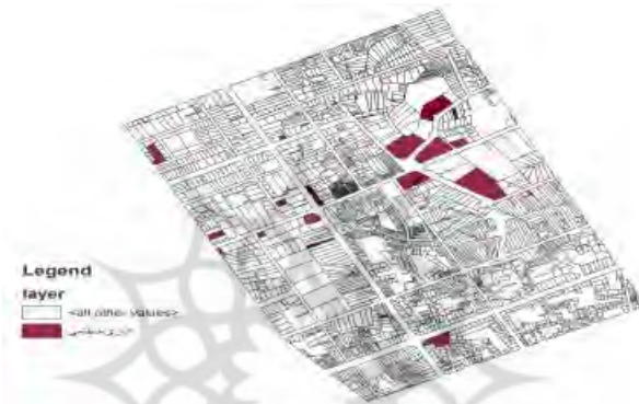
شکل شماره ۳: وضعیت سازگاری کاربری اداری-انتظامی نسبت به سایر کاربری‌ها

کاربری اداری و انتظامی نسبت به خودش کاربری‌های آموزشی، کاربری مسکونی و کاربری وضعیت سازگار دارد. این کاربری، با کاربری تجاری مذهبی ناسازگار است. از وضعیت نسبتاً سازگار برخوردار بوده و با