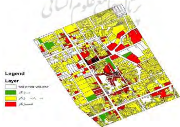
شکل شماره ۴: پراکندگی کاربری آموزشی در منطقه مورد مطالعه.

کاربری اداری و انتظامی نسبت به خودش کاربری‌های آموزشی، کاربری مسکونی و کاربری وضعیت سازگار دارد. این کاربری، با کاربری تجاری مذهبی ناسازگار است. از وضعیت نسبتاً سازگار برخوردار بوده و با