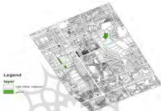
شکل شماره ۹: وضعیت سازگاری کاربری مذهبی نسبت به سایر کاربری‌ها

نسبت به کاربری اداری-انتظامی و کاربری تجاری از وضعیت ناسازگار برخوردار است.