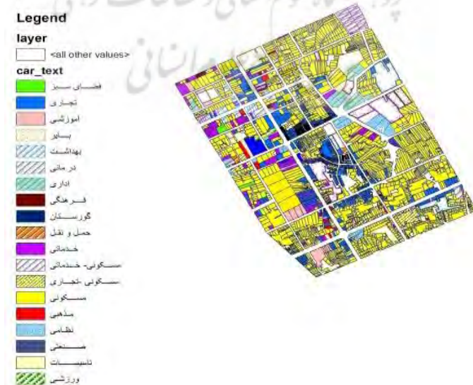
شکل شماره ۱: پراکندگی کاربری‌های مختلف در منطقه مورد مطالعه

این کاربری‌ها در نرم افزار GIS با توجه به مولفه‌های موجود، مورد تجزیه و تحلیل قرار گرفتند و سازگاری یا عدم سازگاری هر یک از این کاربری‌ها مشخص گردید.