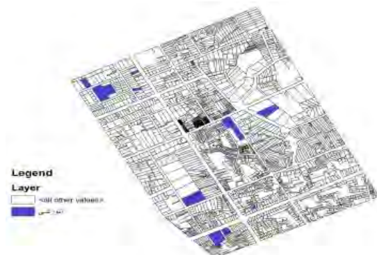
شکل شماره ۵: وضعیت سازگاری کاربری آموزشی نسبت به سایر کاربری‌ها

تجاری و کاربری اداری ۰ انتظامی از وضعیت ناسازگار برخوردار است.