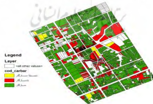
شکل شماره ۱۰: پراکندگی کاربری مسکونی در منطقه مورد مطالعه