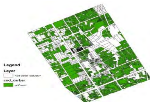
شکل شماره ۱۱: وضعیت سازگاری کاربری مسکونی نسبت به سایر کاربری‌ها

کاربری آموزشی موجود در منطقه مورد مطالعه، در ارتباط با خودش از وضعیت سازگار برخوردار است. این کاربری با کاربری‌های آموزشی و مذهبی وضعیت نسبتاً سازگاری دارد و نسبت به کاربری‌های تجاری و اداری ۰ انتظامی از وضعیت ناسازگار برخوردار است.