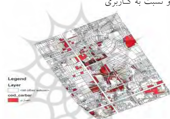
شکل شماره ۶: پراکندگی کاربری تجاری در منطقه مورد مطالعه

کاربری آموزشی نیست به خودش وضعیتی سازگار دارد. نسبت به کاربری مسکونی و کاربری مذهبی از وضعیتی نسبتاً سازگار و نسبت به کاربری