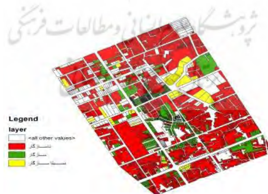
شکل شماره ۷: وضعیت سازگاری کاربری تجاری نسبت به سایر کاربری‌ها

مسکونی و مذهبی از وضعیت ناسازگار برخوردار است.