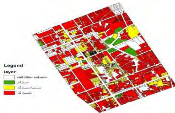
شکل شماره ۲: پراکندگی کاربری اداری-انتظامی در منطقه مورد مطالعه.