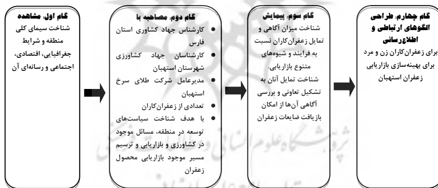
شکل ۱ مراحل الگوی پژوهش

این پژوهش با روش پیمایش مقطعی ۱ انجام شده است. جمعیت پژوهش زعفران کاران شهرستان استهبان استان فارس (۳۵۰ نفر) بودند و نمونه مورد مطالعه طبق فرمول شفر، ۹۰ نفر (۶۰ مرد و ۳۰ زن) زعفران کار انتخاب شدند. زنان انتخاب شده سرپرست خانوار بودند و به طور مستقل جزء بهره برداران زعفران به شمار می آمدند. به منظور جمع آوری جامع داده ها، از روش های مشاهده ۲ و مصاحبه ۳ قبل از پیمایش بهره گرفته شد. به منظور بررسی پایایی ۴ سؤال های پرسش نامه برای پیمایش، یک آزمون راهنما از سی تن از زعفران کاران خارج از نمونه انجام شد. ضرایب آلفای کرونباخ متغیرها بین ۰/۷۰ تا ۰/۸۹ به دست آمد. روایی صورتی ۵ پرسش نامه نیز توسط چهار تن از صاحب نظران ترویج و آموزش کشاورزی تأیید شد. متغیرها با سطح سنجش نسبی تجزیه و تحلیل شدند؛ به گونه ای که هر یک از متغیرها با چندین گویه در قالب طیف لیکرت سنجیده شد و در نهایت، متغیر نهایی از حاصل جمع امتیاز گویه ها به دست آمد.