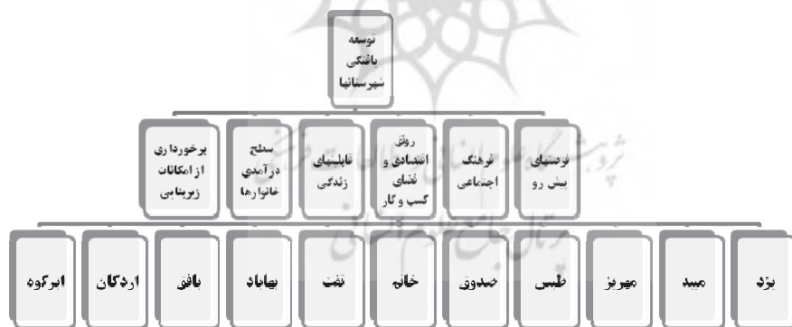
شکل (۲): سلسله‌مراتب توسعه‌یافتگی شهرستان‌های استان یزد

در این مرحله، مطابق شکل (۲)، هدف کلی "تعیین توسعه‌یافتگی شهرستان‌های استان یزد" انتخاب شد و شش معیار سطح برخورداری از امکانات زیربنایی (شبکه آب، برق، گاز، پست و مخابرات، راه، شهرک‌ها و نواحی صنعتی و غیره)، سطح درآمدی خانوارها، سطح برخورداری به لحاظ قابلیت‌های زندگی (شرایط اقلیمی، موقعیت جغرافیایی، امنیت، شرایط بهداشتی و درمانی، محیط زیست و تسهیلات و امکانات زندگی)، سطح برخورداری از رونق اقتصادی و فضای کسب و کار (کشاورزی، صنعت، دامداری، ارائه تسهیلات، خیرین، گردش مالی و غیره)، برخورداری فرهنگ اجتماعی (هویت فرهنگی، سطح فرهنگ عمومی و غیره) و برخورداری از فرصت‌های پیش‌رو (سرمایه انسانی، روابط، نفوذ و دینفعان) در نظر گرفته شد. بدیهی است که گزینه‌های انتخابی، ۱۱ شهرستان استان یزد است.