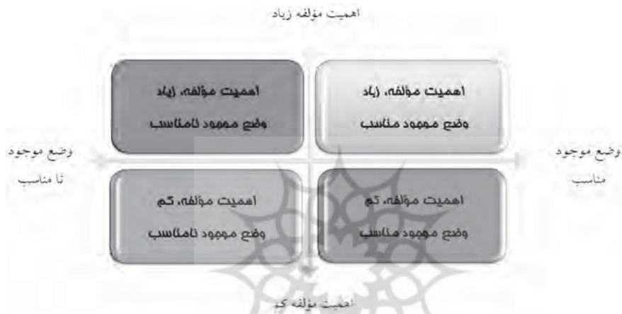
شکل (۳): ماتریس اهمیت - وضعیت الزام‌ها

بودجه‌ریزی عملیاتی استخراج گردید و پراهمیت یا کم‌اهمیت بودن آنها از دید خبرگان بررسی شد. در گام بعد، مناسب بودن یا نبودن وضعیت موجود مؤلفه‌های مذکور، برای استقرار نظام بودجه‌ریزی عملیاتی در مؤسسات اعتباری غیربانکی مورد توجه قرار گرفت. برای جمع‌بندی بخشی از نتایج پژوهش، ماتریس زیر در قالب چهار جدول جداگانه ارائه می‌گردد.