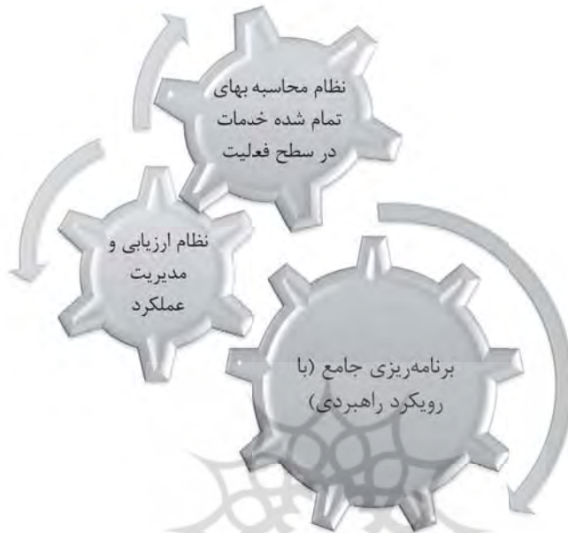
شکل (۱): عناصر اصلی نظام بودجه‌ریزی عملیاتی