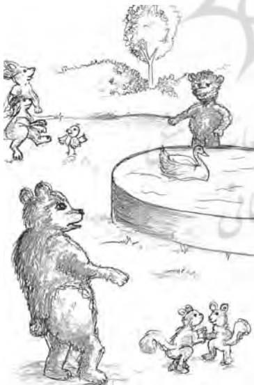
ج: باز پیوند

پژوهشگاه علوم انسانی و مطالعات پرمال جامع علوم انسانی