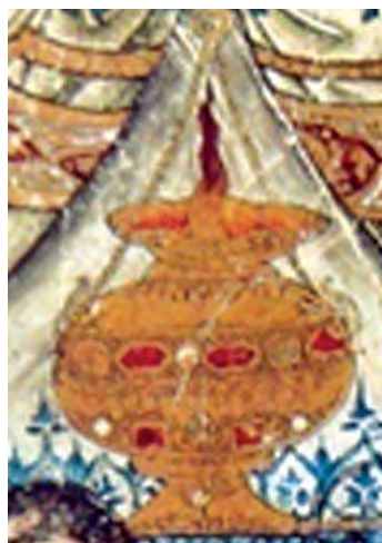
تصویر ۷- چراغ مسجدان شیشیه میناکاری، دوره مملوکی سوریه، نیمه دوم قرن هفتم ق، دیمانده، ماخذ: ۱۳۸۳: ۱۰۳