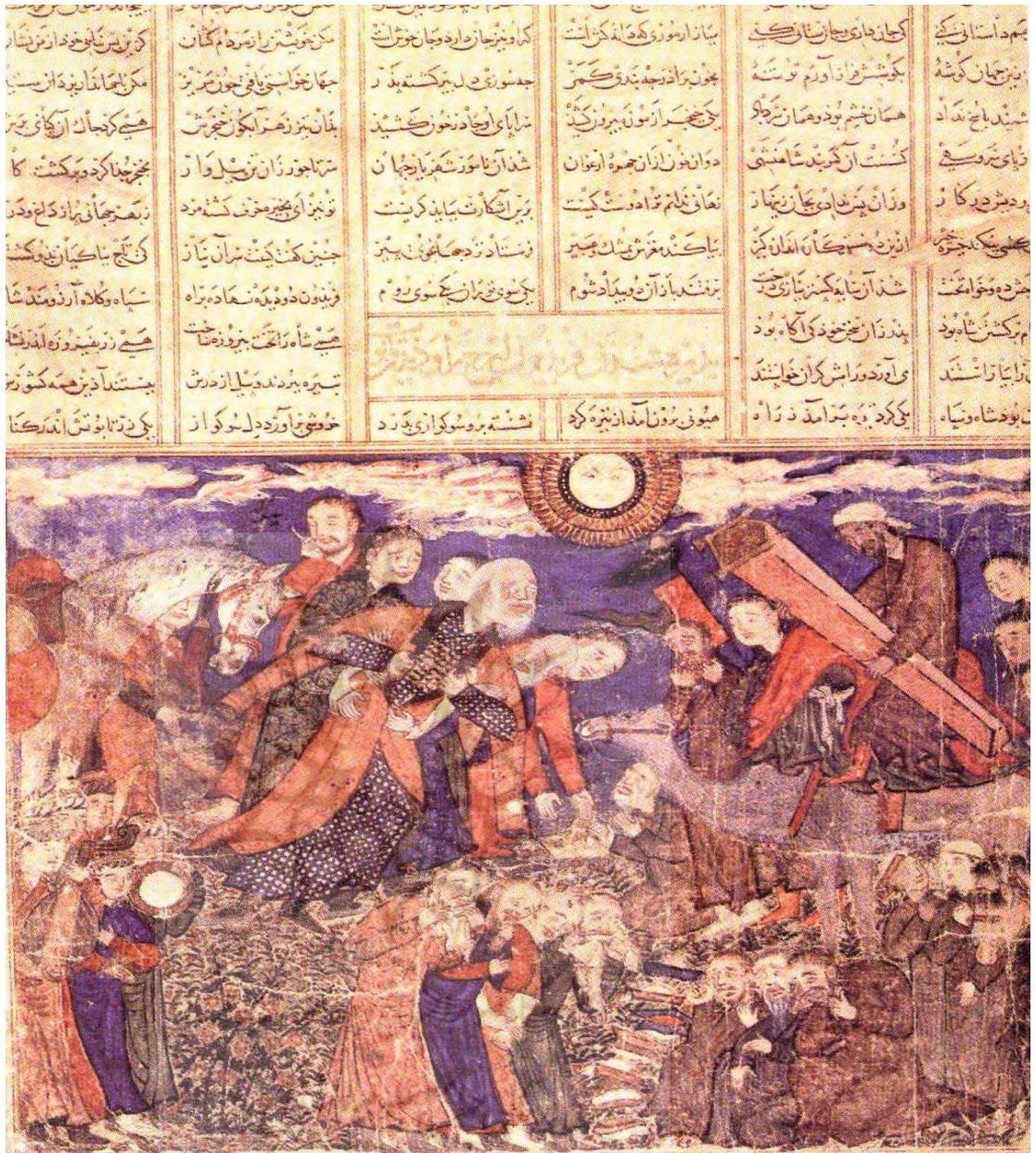
تصویر ۱۰- آوردن تابوت ایرج برای فریدون، سالکرگالری، ماخذ: شریدر، ۱۳۷۷: ۵۶