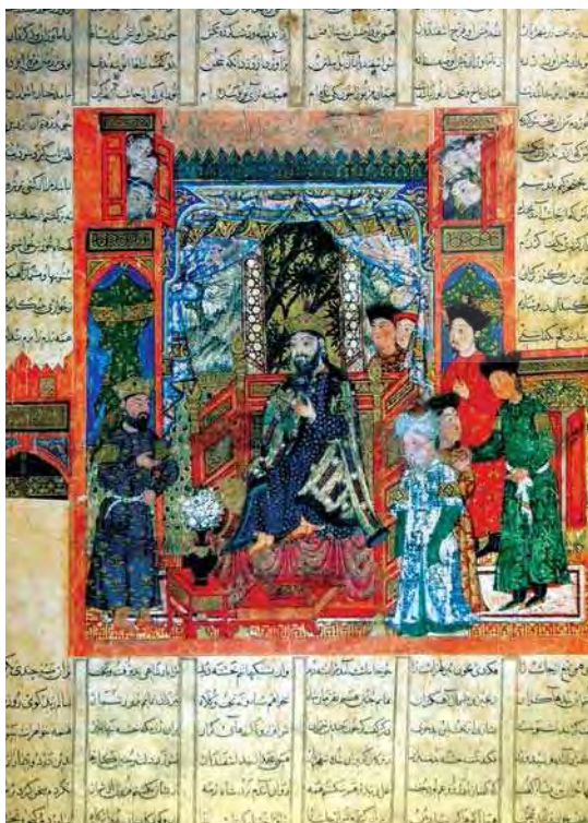
تصویر ۲- صورت گشتاسب و آمدن اسفندیار نزدیک او، شاهنامه ابوسعیدی