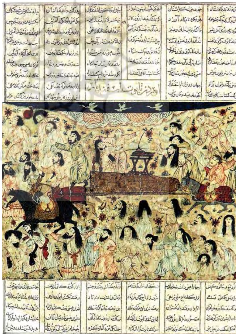
تصویر ۳- تشییع جنازه اسفندیار، موزه متروپولیتن نیویورک

۱. آداب و رسوم مغولان، به‌ویژه آیین سوگواری ایشان، کدام‌اند؟