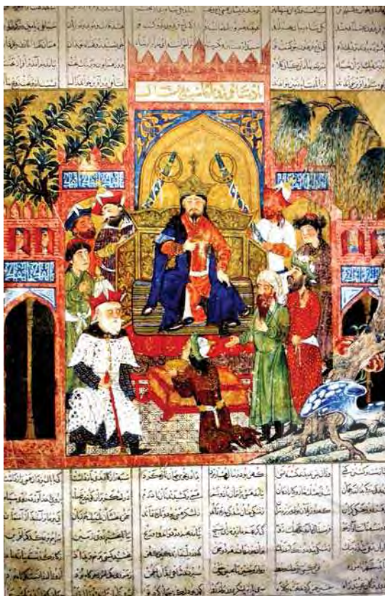
تصویر ۱- تاجگذاری شاهزاد پسر طهماسب، شاهنامه ابوسعیدی، ماخذ: carboni and Komaroff, 2002: 41

اریک شرویدر نیز در کتاب دوازده رخ مقاله مفصلی درباره شاهنامه ابوسعیدی (دموت) دارد که در آن به موضوعاتی چون نقاشان این شاهنامه و مقایسه جامه ها برای تاریخ گذاری آن اشاره می کند. عبدالمجید شریف زاده در مقاله ای با عنوان «هنر ایلیخانی و شاهنامه مستوفی» در