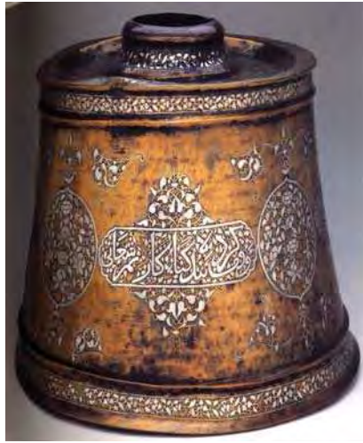
تصویر ۹- پایه شمعدان برنج، ۷۰۸ق، درمالکی تاستورا، ماخذ: پوپ، ۱۳۶۹: ۱۳۵۵