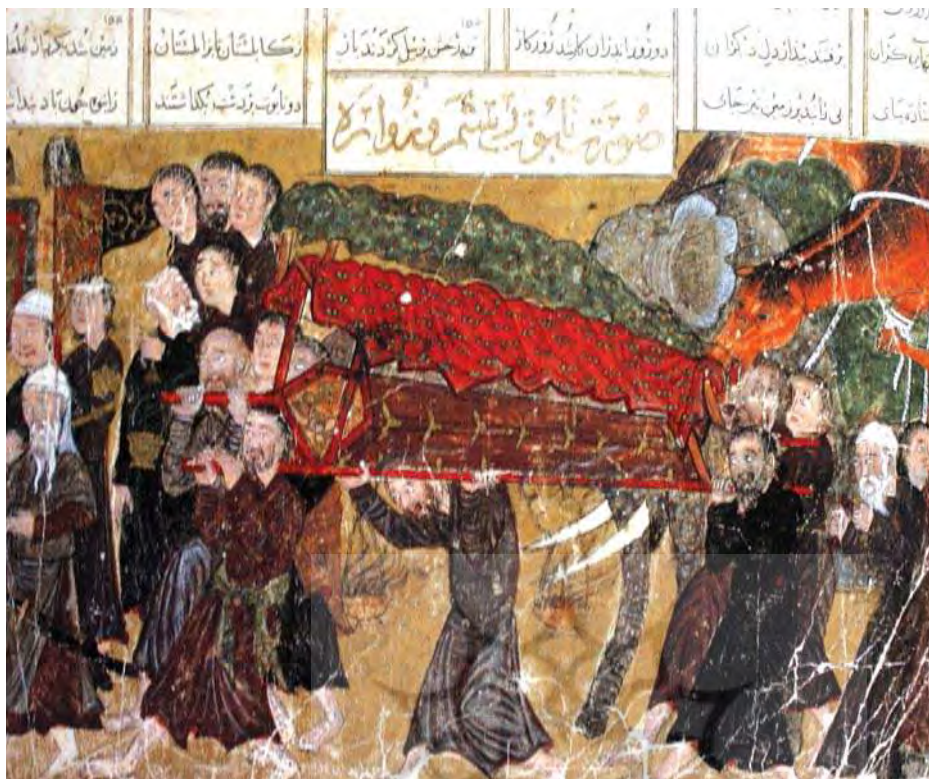
تصویر ۴- تابوت رستم و زواره، موزه متروپولیتن نیویورک، ماخذ: همان: ۱۰۸

قام می‌گفتند. چون مغولان علم و معرفتی نداشتند، از قدیم پیروی از سخنان قامان می‌کرده‌اند و شاهزادگان به سخن و ادعاهای آنان اعتقاد داشته‌اند» (جوینی، ۱۳۶۲: ۵۵). «در این میان، کسانی که می‌توانستند ملتفت سحر و جادو شوند و آن‌ها را کشف و دفع کنند جماعتی بودند از کشیشان بت‌پرست بودایی به نام بخشی. این بخشیان، که توسط مغولان به کار دبیری کتابت گماشته شده بودند، دسته‌ای از مغولان را به آیین بت‌پرستی بودایی و احترام به آفتاب واداشتند» (آشتیانی، ۱۳۸۰: ۸۷).