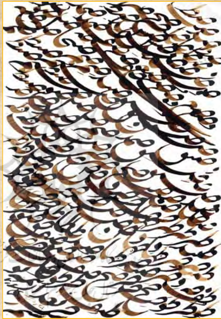
سیاهمشق تمرینی و قلم‌گردانی

با عبور دادن حروف و کلمات از روی یکدیگر و تکرار چندباره آن‌ها به‌طور طبیعی یا برنامه‌ریزی شده می‌توان بافت و توده‌ای از آن‌ها را شکل‌آفرینی کرد. برای آشنا کردن بچه‌ها می‌توان نمونه‌هایی را ارائه داد: