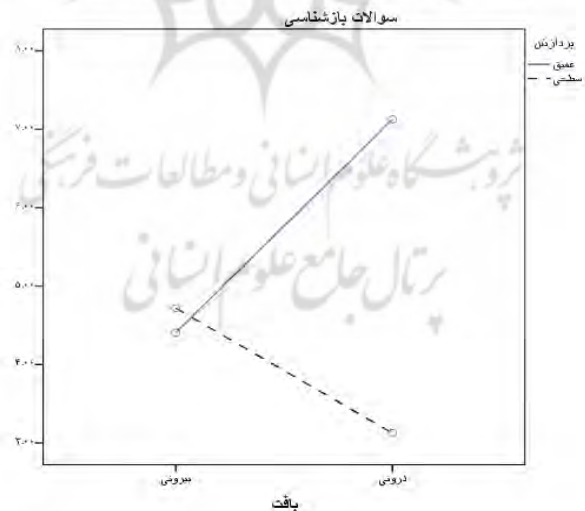
نمودار ۱: اثر تعاملی سطح پردازش و بافت مفهومی را در سئوال‌ات بازشناسی

اثر تعاملی نوع سؤال و نوع بافت مفهومی معنی‌دار بود ( P < 0/05 & f = 4/635 ). به عبارتی سئوال‌ات بازشناسی هنگامی به نمره بالاتر منجر می‌شوند که از بافت مفهومی درونی باشند و سئوال‌ات یادآوری در صورتی به نمره بالاتر منجر می‌شوند که از بافت مفهومی بیرونی طرح شده باشند. همچنین اثر تعاملی نوع بافت و سطح پردازش معنی‌دار است ( P < 0/01 & f = 7/362 )، یعنی سئوال‌ات دارای بافت مفهومی درونی در صورتی منجر به عملکرد بهتر حافظه شده‌اند که سطح پردازش سئوال‌ات عمیق‌تر باشد. نمودار شماره یک اثر تعاملی سطح پردازش و بافت مفهومی را در سئوال‌ات بازشناسی و نمودار شماره دو اثرات تعاملی سطح پردازش و بافت مفهومی را در سئوال‌ات یادآوری نشان می‌دهد.