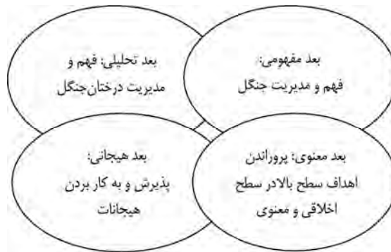
شکل ۱: ابعاد رهبری کل‌نگر بر اساس الگوی ACES برگرفته از: کوآترو، والدمن و گالوین، ۲۰۰۷، ص ۴۲۹

از میان ابعاد مذکور، امروزه با توجه به حرکت فزاینده به سمت جهانی شدن به بعد معنوی توجه فراوانی شده است (دانوز و هیپ، ۲۰۰۲؛ فارل، ۲۰۰۳). این موضوع نیاز به حضور ارزش‌های اخلاقی را در دنیای کاری امروز بیش از پیش نشان می‌دهد (جونگ، نامکونگ و یون، ۲۰۱۳)؛ که وجود ارزش‌های مذکور مستلزم نیروهای تحصیلکرده و در عین حال برانگیخته به وسیله نیازهای سطوح بالا در سلسله‌مراتب مازلو از جمله نیاز خودشکوفایی ۴ می‌باشد (آبرامسون و اینگلهارت، ۱۹۹۵). براساس این نیاز، افراد به دنبال تطبیق زندگی کاری با عقاید اخلاقی هستند (هارمن و اسچافر، ۲۰۰۱ ۶ ؛ نیل، ۲۰۰۷ و کوآترو، ۲۰۰۴ ۸ ).