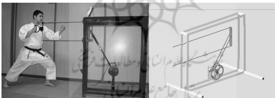
شکل ۲. نمای کلی دستگاه تقویت زوکی

دستگاه موردنظر یک دستگاه کاملاً مکانیکی و دینامیکی متشکل از اجزایی چون رولبرینگ، دسته، قسمت اصطکاکی جهت ایجاد مقاومت مورد نظر و قسمت‌های دیگر است که باید زیر نظر یک متخصص تراش کاری شوند (شکل ۱ و ۲).