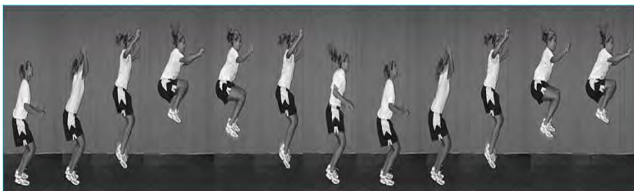
شکل ۱. پرش تاک

دوربین‌ها با توجه به قد آزمودنی و به موازات صفحات عرضی و سهمی نسبت به آزمودنی تنظیم شدند. پس از انجام آزمون، برای بررسی سکانس‌های پرش از نرم‌افزاری ویژه ۱ استفاده و وضعیت تنه حین فرود در صفحات عرضی و سهمی بررسی شد (۴۱).