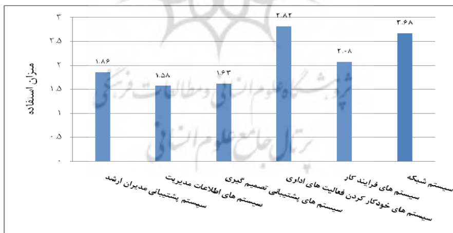
شکل ۱ - میزان استفاده فدراسیون ها از ابعاد فناوری اطلاعات