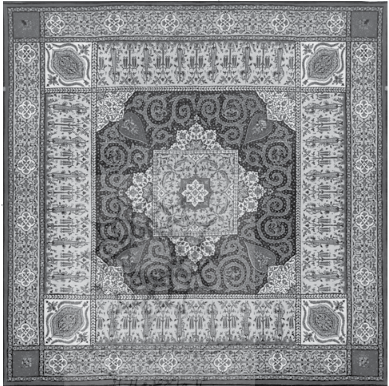
ابريشم اريب بافت چاپي و نقاشي شده، ساخت يزد سده ۱۱ هـ.ق. مجموعه خانم دلبليو، اچ مور، ۱۰۶/۶ سانتيمتر مربع منبع: كتاب سيري در هنر ايران، نوشته آرتور پوپ