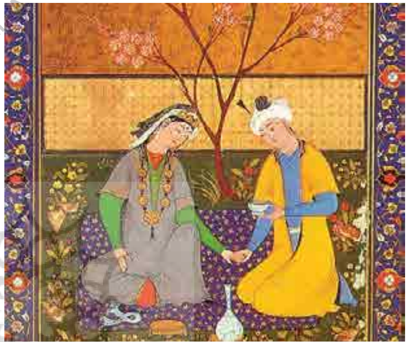
جدول شماره ۴: طیف زرد

طبق عادات، مردم دریافت‌های منفی‌گرایی چون سودجویی، فرومایگی، خشم، حسد و عصبانیت را از این رنگ دارند. به‌عنوان مثال به شخص عصبانی «صفرایی مزاج» می‌گویند. اعتقاد بر این است که رنگ زرد بیانگر ویژگی‌های منفی فرد است. همچنین این رنگ احساس تزلزل فوق‌العاده‌ای در انسان به‌وجود می‌آورد. پس اگر کسی خودخواه، متعصب و یا عصبی است نباید زیاد با رنگ زرد سر و کار داشته باشد. (برندفلمار، ۱۳۷۶: ۳۰-۳۲)