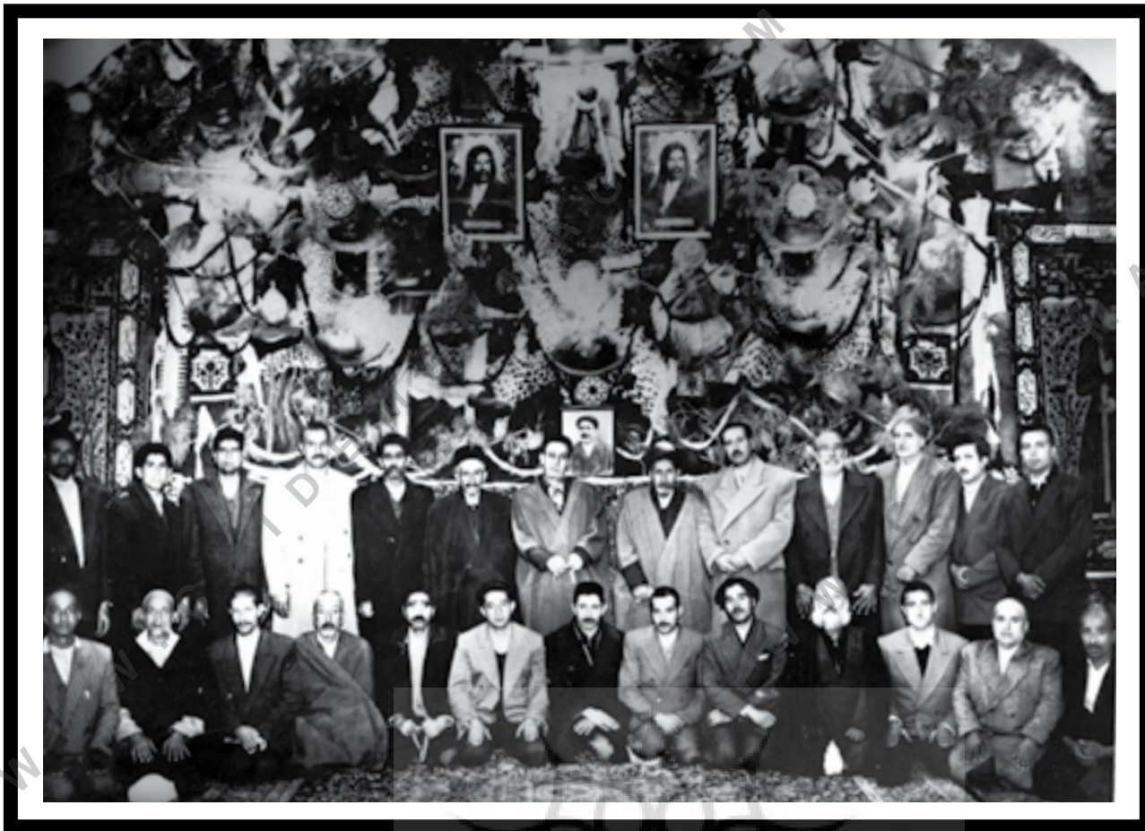
مراسم میلاد حضرت علی(ع)