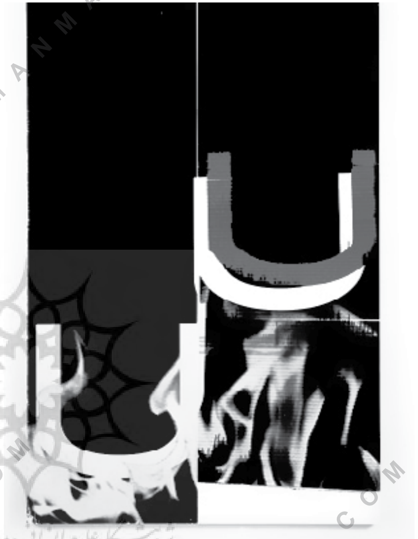
تصویر شماره ۱: وید گایتون (اثر بدون عنوان گایتون از سال ۲۰۰۶ در میان یکی از هشتاد اثر انتخاب شده)