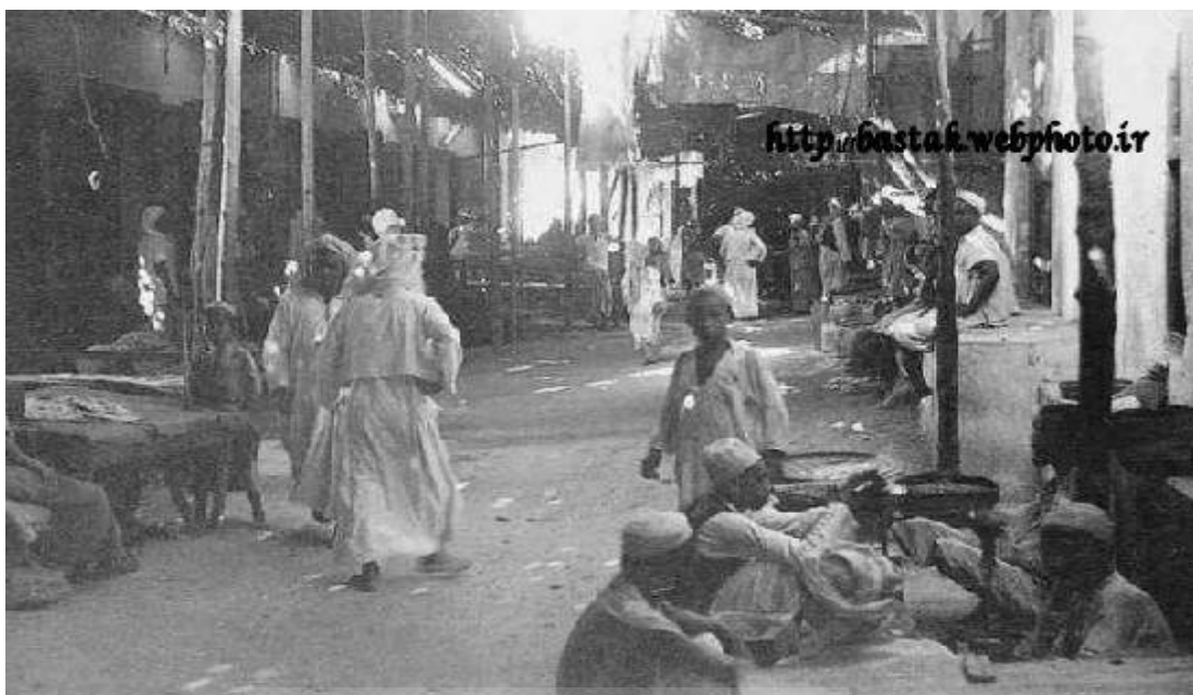
عکس شماره ۱: تصویری از بازار قدیمی دبی که اکثر تجار آن از مهاجران بستکی ساکن بستکيه بودند.