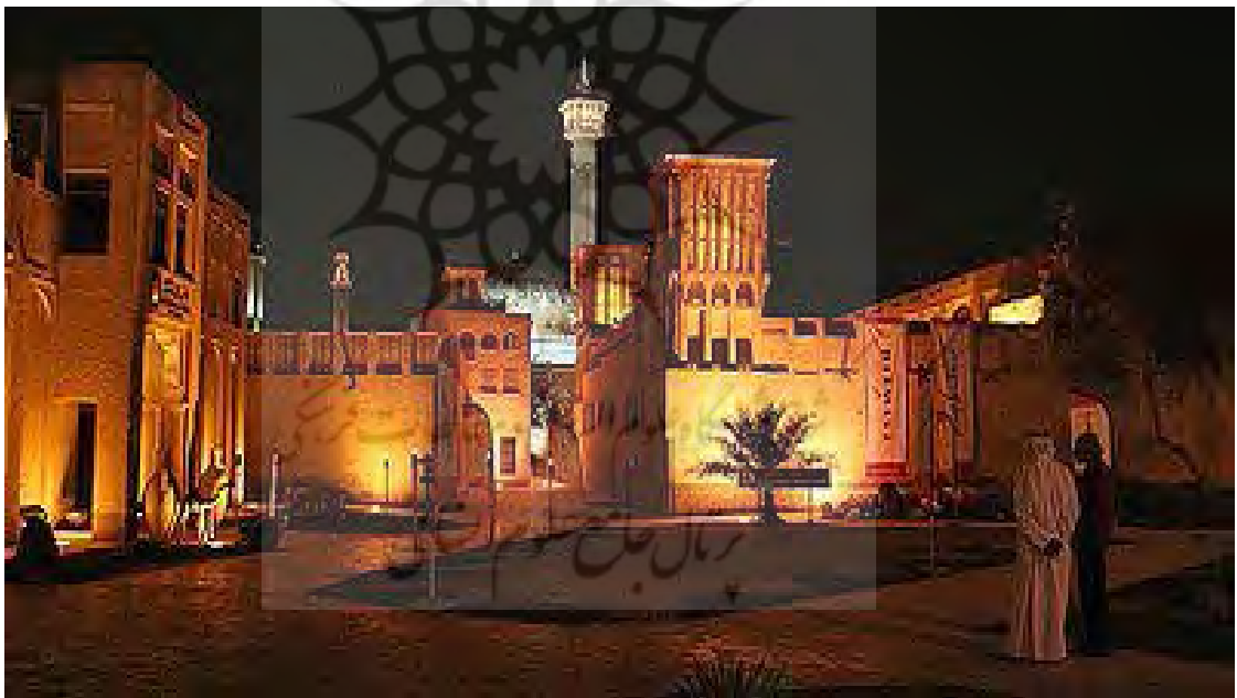
عکس شماره ۸: نمایی از مرکز البستکیه در شب