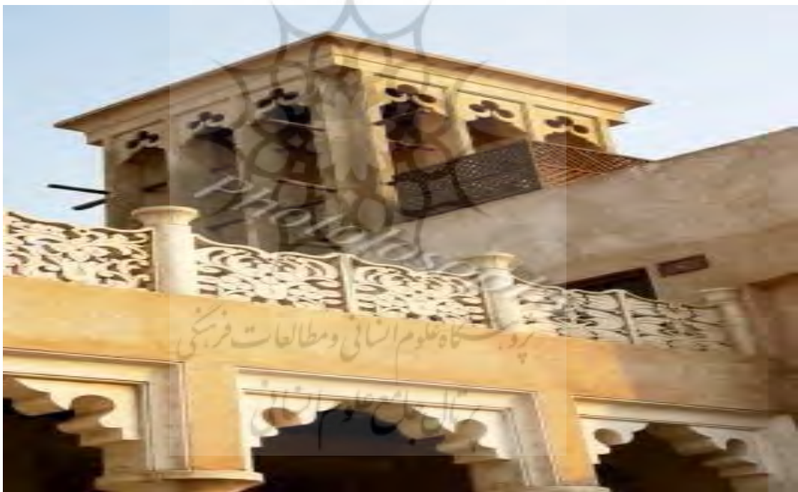
عکس شماره ۴: بادگیرخانه های بستکيه (۲)