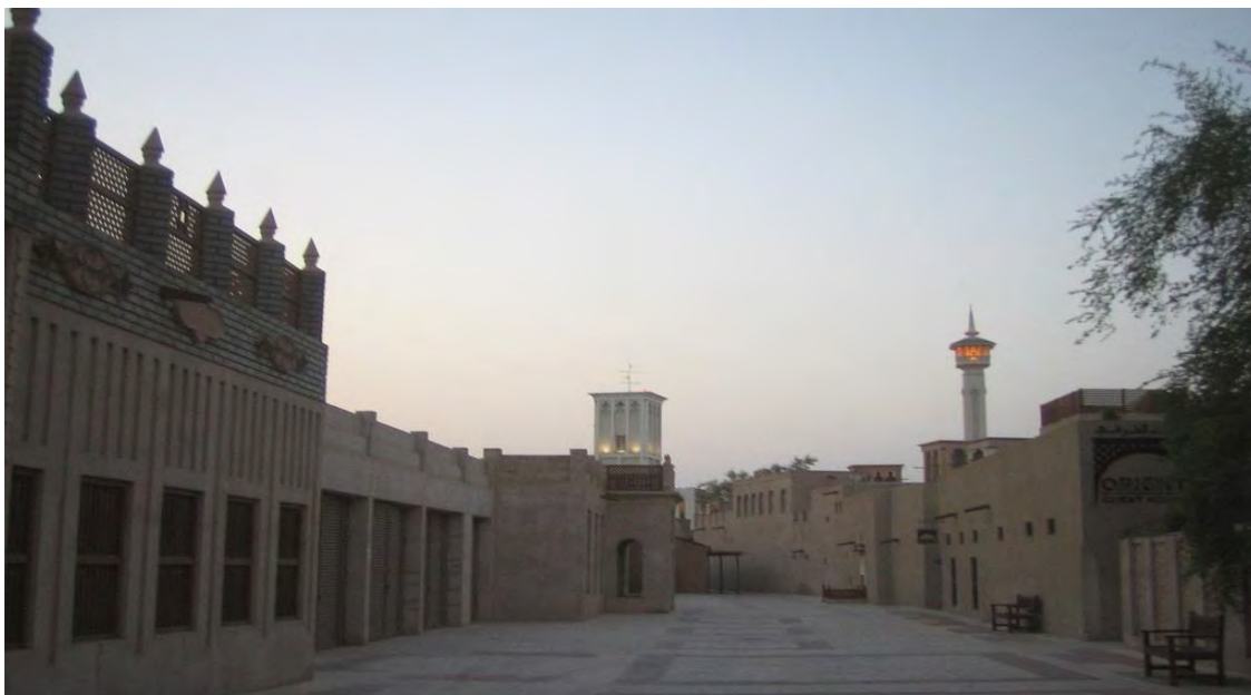
عکس شماره ۵: محله بستکیه پس از بازسازی توسط حکومت دبی (۱)