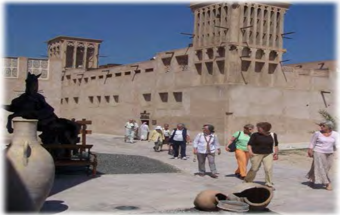
عکس شماره ۷: بازدید توریست‌ها از محله البستکیه