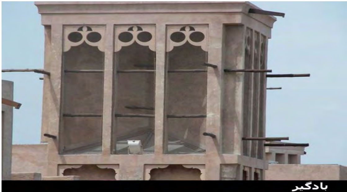
عکس شماره ۳: نمونه ای از بادگیرهای خانه های محله بسکیه (۱)