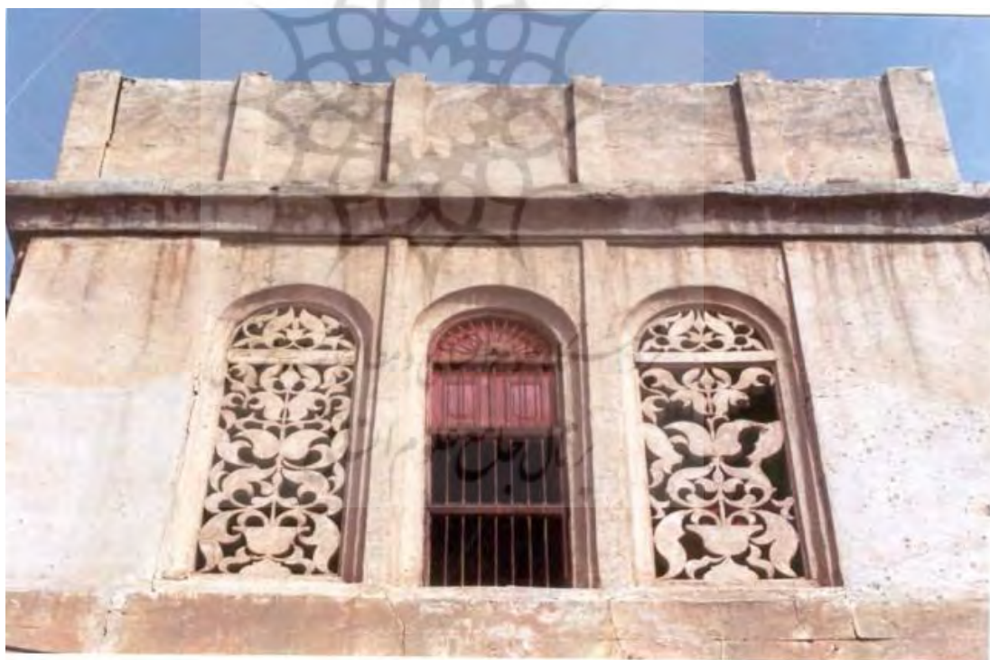
عکس شماره ۲: تصویری از یکی از خانه‌های قدیمی بستکيه