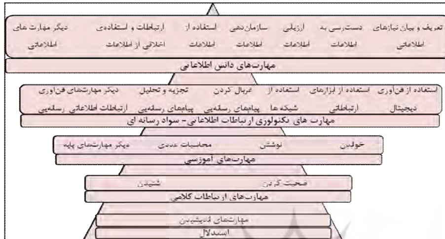
نمودار (۱). مهارت‌های آموزش

نیازهای زندگی است، و به صورت یک ضرورت برای دستیابی به رفاه فردی، اجتماعی و اقتصادی در آمده است (رضوان و همکاران، ۱۳۸۸؛ وارد، ۲۰۰۶؛ گارنر، ۲۰۰۶؛ کاتس و لو، ۲۰۰۸).