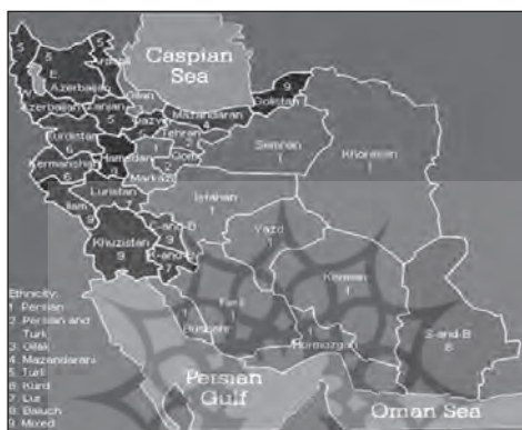
شکل ۱. توزیع جغرافیایی گروه های قومی در ایران ۲

۱۳۸۷: ۱۲۲)، و در این میان در حدود نیمی از جمعیت متعلق به گروه فارس زبان و در حدود ۳۴ درصد نیز متعلق به دو گروه قومی کرد و ترک می باشد و یک ششم باقی مانده نیز مربوط به سایر گروه های زبانی می باشد (عباسی و صادقی ۱۳۸۵: ۲). به این گروه های قومی زبانی می توان ویژگی دیگری را اضافه کرد و اینکه بلوچ ها و کردها بیشتر اهل سنت بوده و ترک ها، گیلکی ها، مازندرانی ها و لر ها بیشتر شیعه هستند (ترابی ۱ و دیگران ۲۰۱۰: ۳۰). همچنین اینکه گروه های قومی ایران از لحاظ جغرافیایی نیز در مناطق مختلفی از کشور پراکنده شده اند. به طوری که فارس زبان ها معمولا در نواحی مرکزی و سایر گروه های قومی در نواحی مرزی و مخصوصا نواحی شمال و شمال غربی کشور می باشند. توزیع جغرافیایی گروه های قومی در شکل (۱) نشان داده شده است.