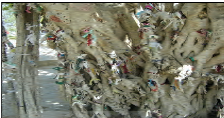
تصویر شماره ۱. مقدس بودن درخت انجیر معابد به عنوان بخشی از اعتقادات مردم.

سبک زندگی، اعتقادات و ارزش‌های متفاوت این افراد بالطبع موجب ایجاد کنش‌های فرهنگی با بومیان خواهد شد (طرح جامع مدیریت سواحل و محیط زیست جزیره کیش، ۱۳۸۶: ۵۶).