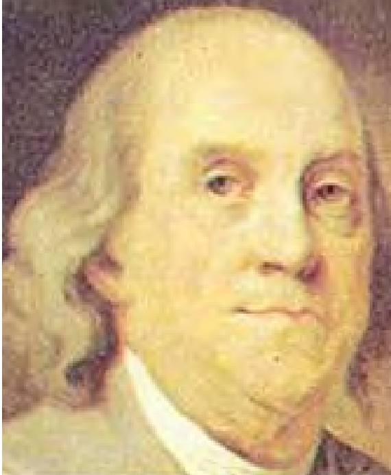
تصویری از فرانکلین، اثر ژان باپتیست گرویتزه