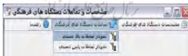
تصویر ۲. منوی مشخصات و تعاملات

پس از اینکه اطلاعات مربوط به نهادهای فرهنگی و نحوه تعامل آنها با یکدیگر بر اساس این فرم تکمیل شد، جهت مشاهده نحوه روابط بالادستی بین آنها از منوی تعاملات نهادهای فرهنگی و با یک کلیک نمودار درختی بالادستی نهادهای فرهنگی، مانند تصویر ۲ ظاهر می شود.