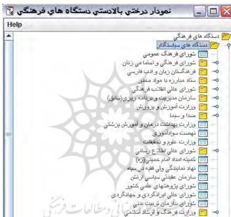
تصویر ۳. نهادهای فرهنگی سیاستگذار

طبق این نمودار می‌توان با کلیک کردن روی هر یک از پوشه‌ها نهادهای فرهنگی مرتبط را مشاهده کرد. برای مثال با کلیک روی پوشه نهادهای سیاستگذار فهرست آن به صورت تصویر ۳ مشاهده می‌شود.