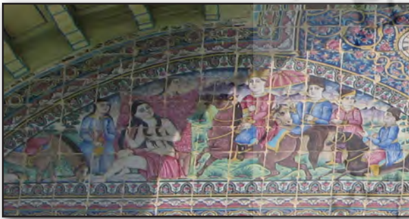
تصویر ۱. هلالی سمت راست، دیدن خسرو شیرین را در چشمه‌سار. عکس: سحر اتحادمحکم، ۱۳۹۰.

از بناهای ماندگار دوره قاجاریه به عنوان سلسله قدرت ساخته است ...". در کاشی نگاره‌های خورشیدی ضلع شرقی کوشک اصلی باغ، مجالسی به نام‌های "مدهوش شدن ندیمگان از جمال یوسف"، "دیدن خسرو شیرین را در چشمه‌سار"، "رستم در بارگاه حضرت سلیمان (ع)" تصویر شده است که هر مجلس داستانی را با مضمون خاص اما در نهان مشترک خود روایت می‌کند. این تصاویر در عین اختلاف، حکایت‌گر و نشأت گرفته از یک مضمون مشترک هستند و آن مضمون مشترک مغلوب و منفعل شدن یک سوی رابطه (ندیم، خسرو، رستم) در برابر سوی دیگر رابطه (یوسف، شیرین، سلیمان) است. در اینجا است که نظر فوکو درباره تأثیر قدرت در شبکه اجتماعی و ارتباطات انسانی و معنا و تفسیر و گفتمانی که از آن می‌جوشد، به کارمان می‌آید. قدرت زیبایی یوسف و قدرت تحریک جنسی شیرین و قدرت معنوی و ایزدی و خداداد سلیمان سوی دیگر رابطه‌ها را گرفتار می‌کند و بقول فوکو هم قدرت بطن این ارتباط است، هم میان فردی قرار دارد و هم دو سوی مجزای ارتباط و حفظ‌کننده آن هستند. یکی از بخش‌های منظومه تغزلی خسرو و شیرین، صحنه اولین دیدار خسرو و شیرین در چشمه‌سار است؛ لحظه‌ای که خسرو، شیرین را در حال آبتنی در چشمه می‌بیند. مصورسازی این قسمت از داستان در هلالی سمت راست سردر ورودی عمارت باغ مجاور دو مجلس مذکور دیده می‌شود (تصویر ۱). مجلس دیگری که در هلالی سمت چپ کاشیکاری عمارت (تصویر ۲) دیده می‌شود، صحنه مدهوش شدن ندیمگان از جمال حضرت یوسف (ع) است.