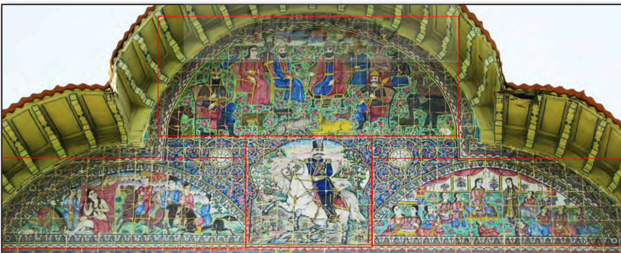
تصویر ۴. سه هلالی سردر ورودی عمارت باغ ارم، عکس: سحر اتحادمحکم، ۱۳۹۰.