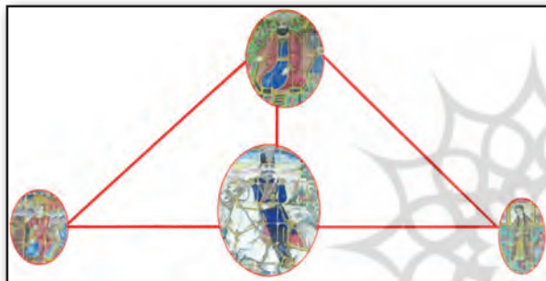
تصویر ۶. عنصر مشترک پادشاه (مرد) در ترکیب‌بندی سه هلالی سردر ورودی باغ ارم.