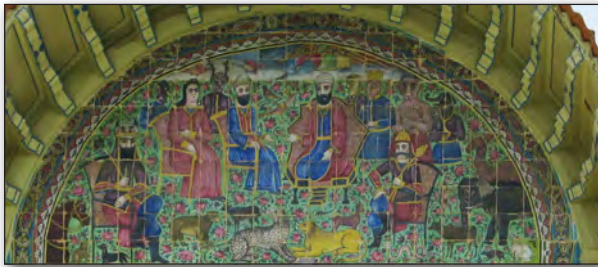
تصویر ۳. هلالی فوقانی، رستم در بارگاه حضرت سلیمان، عکس: سحر اتحاد محکم، ۱۳۹۰.