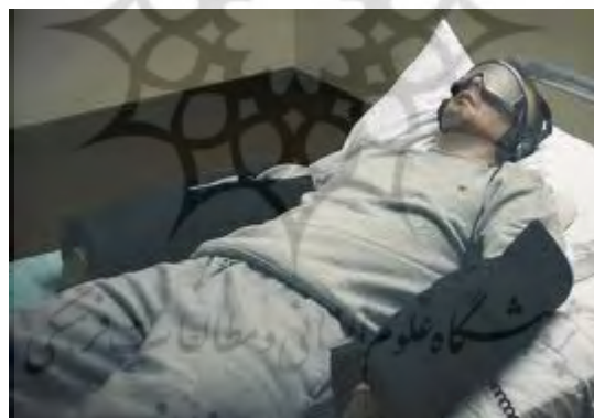
شکل ۱- شرایط آزمایشگاهی محرومیت نسبی حسی

در این وضعیت، فرد احساس تنهایی شدید می‌کند و دچار افسردگی و هیجان‌های متغیری مثل غم یا شادی مفرط می‌شود. چنانچه این شرایط ادامه یابد، شخص در ابتدا دچار توهمات سمعی و بصری نیز می‌شود و حالتی منفعلانه و تلقین‌پذیر پیدا می‌کند (Zuckerman, 2007, P.71). در این شرایط است که با تلقین‌های خاص و پرسش‌های مکرر، اطلاعاتی را از ذهن فرد بیرون می‌کشند و به‌جای آن، اطلاعات مورد نظر خود را به او تزریق می‌کنند (بیروانی، ۱۳۸۸، ص ۲۵۷).