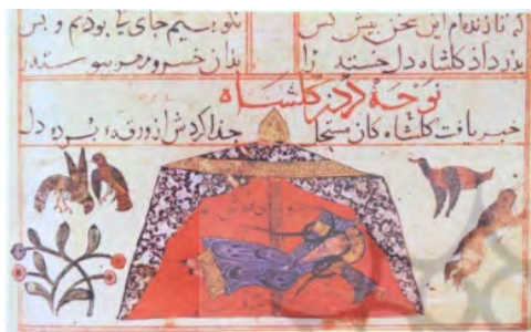
تصویر (۱۶) ورقه و گلشاه (همان)