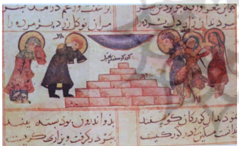
تصویر (۱۷) ورقه و گلشاه (همان)