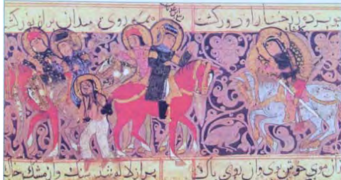
تصویر (۱۵) ورقه و گلشاه (همان)

چهره‌نگاری سلجوقی؛ تداوم فرهنگ بصری مانوی ۱۰۳