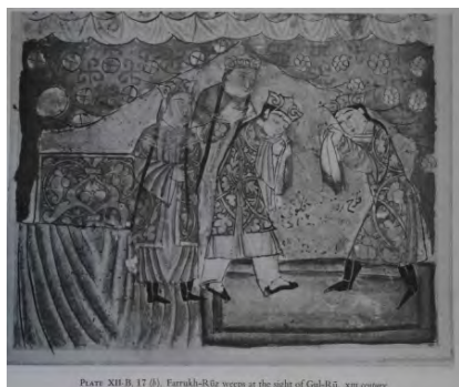
PLATE XII.B.17 (b). Farrukh-Ruz weeps at the sight of Gal-Ru. XIII century

تصویر (۱۱) کتاب سمک عیار، کتابخانه بودلیان، اواسط قرن ۱۳ میلادی.