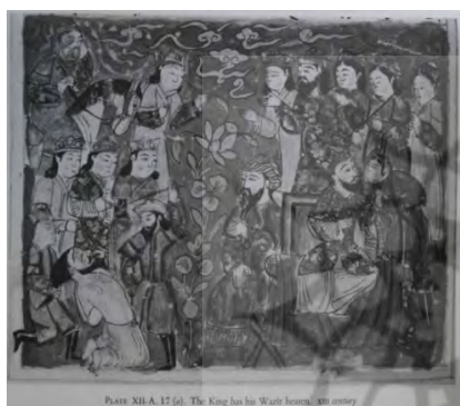
PLATE XII.A.17 (a). The King has his Waith brought. XIII century

تصویر (۱۲) کتاب سمک عیار، کتابخانه بودلیان، اواسط قرن ۱۳ میلادی.