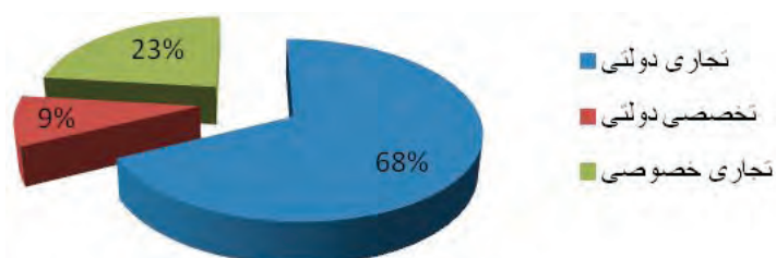
نمودار ۱. سهم بانک‌ها از مطالبات معوق در سال ۸۷

مأخذ: گزارش عملکرد نظام بانکی کشور، (۱۳۸۸)