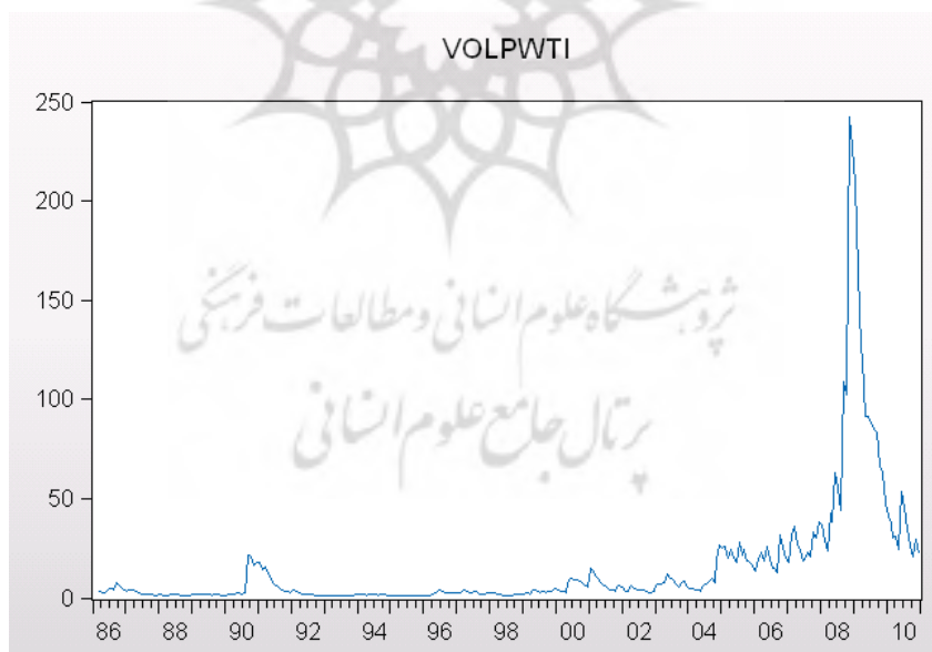
نمودار ۳. روند زمانی تلاطم قیمت نفت خام WTI طی دوره ۲۰۱۰-۱۹۸۶