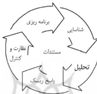
شکل ۱. چرخه مدیریت ریسک

مدیریت ریسک از فازهای برنامه‌ریزی، شناسایی، اندازه‌گیری و تحلیل، ارائه پاسخ (عکس‌العمل در مقابل ریسک) و کنترل ریسک شکل یافته است [۲۲]. به عبارتی دیگر، مدیریت ریسک، کاربرد سیستماتیک سیاست‌های مدیریتی، رویه‌ها و فرآیندهای مربوط به فعالیت‌های شناسایی، تحلیل، ارزیابی و کنترل ریسک می‌باشد [۲۳].