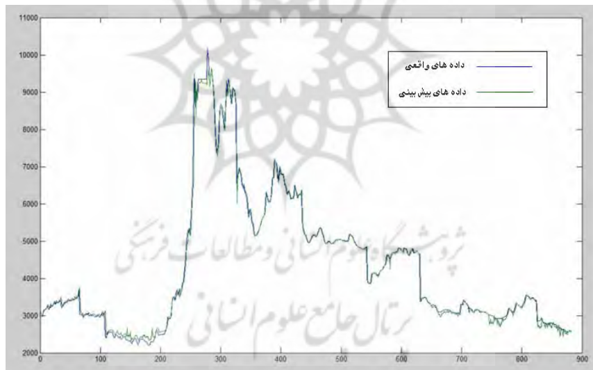
شکل ۲. مقایسه پیش‌بینی شبکه عصبی پیش‌خور و داده‌های واقعی

در مدل پیش‌خور، پس از آموزش شبکه‌ها با ۸۵ درصد داده‌ها، آزمایش شبکه‌ها بر روی ۱۵ درصد باقیمانده داده‌ها انجام گرفته است که بر اساس معیار MSE از میان (7^2 + 7^3 + 7^4) شبکه ساخته شده، شبکه‌ای که دارای کمترین MSE بوده است، به‌عنوان بهینه‌ترین شبکه انتخاب شده است. این شبکه دارای ۳ لایه با چیدمان ۶ نرون در لایه اول، ۷ نرون در لایه دوم، ۴ نرون در لایه سوم و ۱ وقفه بوده است. سپس شبکه بهینه مجدداً بر روی داده‌های آزمایش اجرا شده است که MSE آن 7/9724e-005 به دست آمده است. شکل ۲، تفاوت میان قیمت‌های پیش‌بینی شده توسط شبکه عصبی پیش‌خور و قیمت‌های واقعی را نشان می‌دهد.