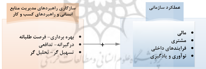
شکل ۱. الگوی مفهومی پژوهش

همچنان که مرور ادبیات نظری نشان می‌دهد، اندیشمندان مختلف هر یک از منظرهای خاص به بهبود عملکرد سازمانی پرداخته‌اند. در پژوهش‌های انجام شده، به صورت نظری بر ارتباط بین سازگاری راهبردهای مدیریت منابع انسانی و راهبردهای کسب و کار و تأثیر آن بر عملکرد سازمانی صحنه گذارده‌اند، اما این رابطه به صورت تجربی مورد تأیید قرار نگرفته است. نوآوری این پژوهش در آزمون تجربی این مبانی نظری است. در پژوهش‌های صورت گرفته، هر یک از راهبردهای کسب و کار و راهبردهای مدیریت منابع انسانی به دسته‌هایی تقسیم‌بندی شده و تناسب و سازگاری میان راهبردهای موجود مورد بررسی قرار می‌گیرد. الگوی مفهومی پژوهش در شکل ۱ نمایش داده شده است. بنا به ادعای مدل مفهومی این پژوهش، سازگاری بین راهبردهای مدیریت منابع انسانی و راهبردهای کسب و کار، عملکرد سازمانی را بهبود خواهد بخشید. عملکرد سازمانی در این مدل با توجه به رویکرد کارت امتیازی متوازن در حوزه‌های مالی، مشتری، فرآیندهای داخلی و نوآوری و یادگیری سنجش خواهد شد.