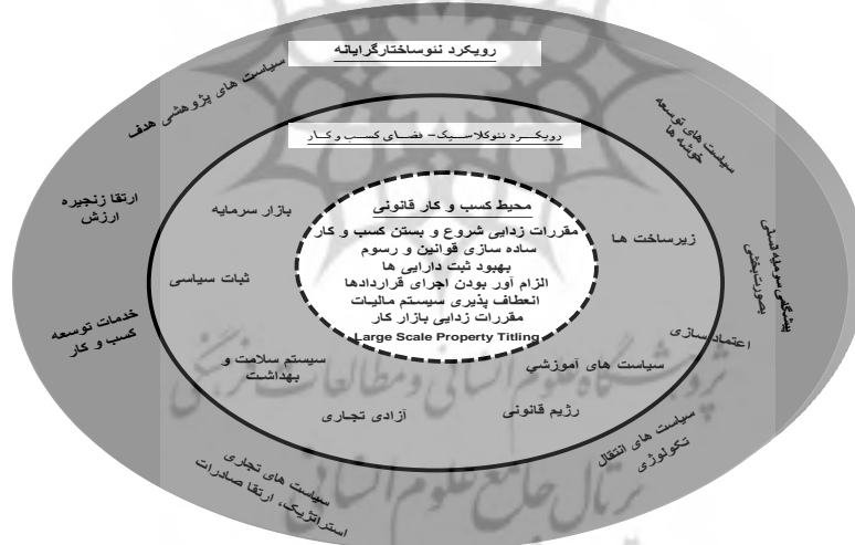
شکل ۳. الگوی محیط کسب و کار یونیدو

منجر به افزایش هزینه‌های مستقیم و غیرمستقیم شرکت‌ها می‌شود. مانند هزینه‌های نیروی کار، تأسیس و انحلال شرکت، مالیات و غیره. این لایه در گزارش سهولت کسب و کار بانک جهانی کاملاً مشهود است. لایه میانی و یا دوم دربرگیرنده رویکرد نئوکلاسیک و یا فضای سرمایه گذاری ۱ است که علاوه بر عناصر محیط قانونی شامل کیفیت زیرساخت‌ها، رژیم قانونی، ثبات سیاسی، بازارهای مالی، آموزش و غیره نیز می‌باشد و می‌تواند به رشد، افزایش بهره‌وری و توسعه مشاغل شرکت‌ها کمک کند. لایه سوم و یا بیرونی رویکرد نئوساختارگرایانه ۲ را شامل می‌شود. دو لایه قبلی به میزان زیادی وابسته به نقش دولت هستند ولی در این لایه نقش بخش خصوصی پررنگ‌تر می‌باشد و هدف ایجاد مزیت رقابتی دانش محور ۳ می‌باشد و مواردی مانند توسعه خوشه‌ها، ارتقای زنجیره ارزش ۴ ، سیاست گذاری انتقال فن آوری ۵ و غیره را شامل می‌شود. شکل ۳ لایه‌های سه گانه این الگو را نشان می‌دهد (Unido,2008).