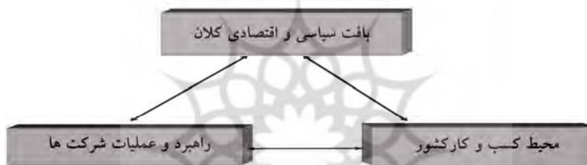
شکل ۱. عوامل اثرگذار بر موفقیت شرکت‌ها

بالا) است (Roland & Porter, 2000). از بالا به پایین، بافت سیاسی و اقتصادی بستر ساز بوده، محیط کسب و کار فضای بهره‌وری و محیط رقابت شرکت‌ها را بهبود می‌بخشد، استراتژی و عملیات شرکت‌ها مناسبات داخلی و یا ثبات برای رشد بهره‌وری شرکت‌ها را فراهم می‌سازد. از پایین به بالا نیز بهره‌وری و کارآئی مناسب شرکت‌ها موجب افزایش درآمد و رشد مالیات‌ها گردیده و با تأمین منابع مالی به دولت یاری می‌رساند. بهبود فضای کسب و کار نیز به بهبود نهادهای سیاسی و اقتصادی کمک می‌کند. از سوی دیگر ضعف در محیط کسب و کار کشور، فرایند تولید و سیاست‌گذاری اقتصادی را به هم می‌ریزد و موجب بازدارندگی تولید می‌شود (Porter, 2009).