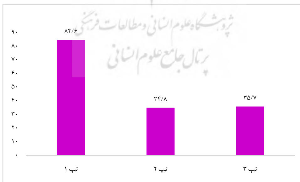
نمودار ۱: فراوانی میزان رعایت الزامات کاربری در سیستم ثبت داده‌های مرگ و میر در ایران از دیدگاه کاربران