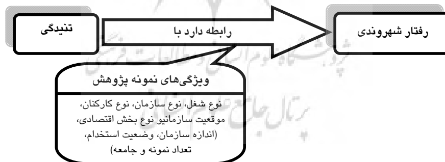
شکل ۲ مدل نهایی تحقیق

در این پژوهش، متغیرهای مربوط به ویژگی‌های نمونه که رابطه تنیدگی و رفتار شهروندی را متأثر ساخته‌اند، بررسی می‌شوند. این متغیرها شامل نوع شغل و بخش اقتصادی، اندازه و نوع سازمان و کارکنان، درجه توسعه یافتگی کشور، وضعیت استخدام، موقعیت سازمانی، تعداد نمونه و جامعه آماری می‌باشند. به تعداد این متغیرها فرضیه طراحی و آزمون انجام گرفت و در نهایت مشخص شد؛ نوع شغل، نوع سازمان، موقعیت سازمانی، نوع کارکنان و تعداد جامعه آماری رابطه تنیدگی و OCB را تعدیل نموده‌اند. البته از بین فرضیه‌های تأیید نشده نیز فرضیه‌های جزئی‌تر پذیرفته شدند که از جمله تفاوت اندازه اثر تنیدگی بر OCB-O، در دو بخش صنعت و خدمات، اثر اندازه سازمان بر رابطه تنیدگی عاطفی و OCB، اثر تعداد نمونه بر رابطه تنیدگی و OCB-O و اثر وضعیت استخدام بر رابطه تنیدگی و OCB-O می‌باشد. بنابراین با توجه به نتایج آزمون فرضیه‌ها مدل مفهومی پژوهش به شکل زیر نهایی می‌شود: