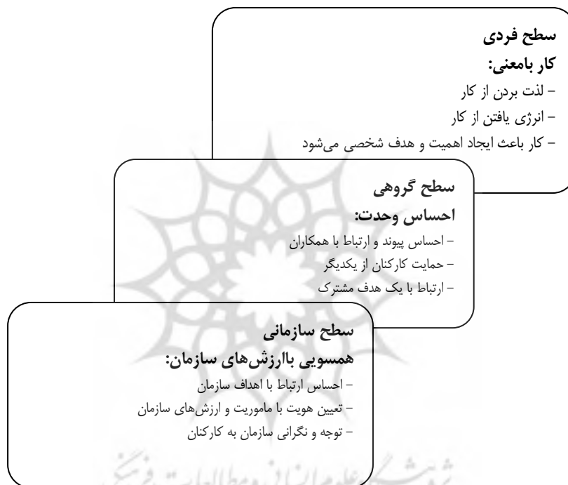
شکل ۱. ابعاد و سطوح معنویت در محیط کار [۱۷]

میتروف و دنتون ۱ (۱۹۹۹) ابعاد و عناصر زیر را برای معنویت در نظر گرفتند: غیررسمی و غیرساختارمند بودن؛ به‌طور گسترده در برگیرنده و پذیرنده همه بودن؛ همگانی و بی‌انتهای بودن؛ منشاء و فراهم‌کننده معنا و هدف در زندگی بودن؛ احساس ترس در پیشگاه وجودی متعالی؛ تقدس هر چیزی؛ حس عمیق ارتباط همه چیز با یکدیگر؛ آرامش و دوستی بیشتر؛ منبع بی‌پایان از ایمان و انگیزش [۱۵].