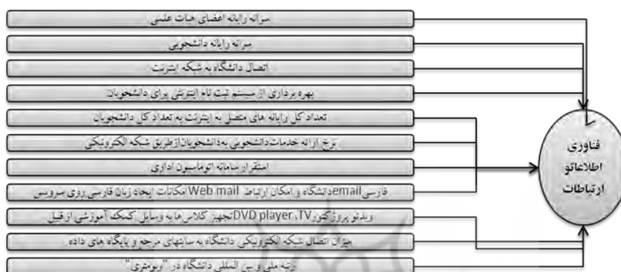
نمودار ۲. شاخص‌های پذیرفته شده در پرسشنامه‌ی شماره ۱

شماره ۲ با توجه به شاخص‌های موجود تدوین شد تا در آن به بررسی میزان تأثیر هر کدام از این شاخص‌ها بر عامل فناوری اطلاعات و ارتباطات پرداخته شود. سپس پرسشنامه‌ی یادشده در قالب بررسی میدانی از دو گروه خبرگان و اجرایی در مراکز مورد مطالعه، با استفاده از روش‌های آماری مناسب، تجزیه و تحلیل شده و مورد سنجش قرار گرفت. در گام پنجم با استفاده از تحلیل عاملی، داده‌ها مورد بررسی قرار گرفت. در گام ششم با جمع‌بندی نتایج مراحل قبل، به ۲ پرسش مطرح شده پاسخ داده و در گام نهایی با توجه به یافته‌ها، نتیجه‌گیری مناسب به عمل آمده و پیشنهادهای علمی و کاربردی ارائه گردیده است.