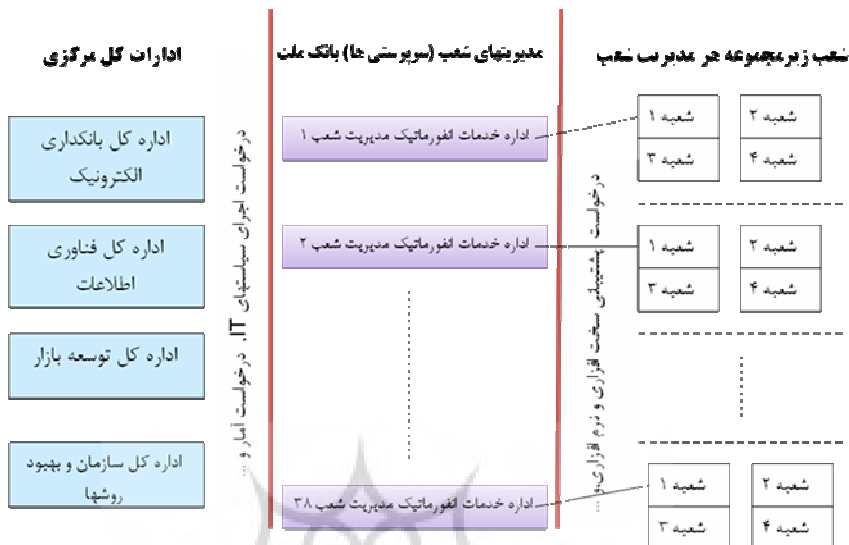
شکل ۱: نحوه تعاملات ادارات خدمات انفورماتیک با سایر واحدهای بانک ملت