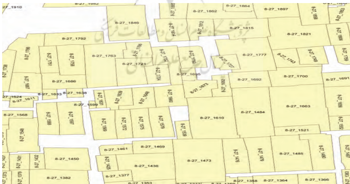
شکل ۱. کدگذاری کاداستر قطعات ملکی منطقه ۸ شهرداری تبریز

در سیستم کاداستر موجود با نقشه‌های کاغذی، برخی از مشکلات عمده همچون عدم امکان اشتراک داده‌های نقشه در یک سیستم واحد دقت نه چندان مناسب داده‌های ژئودزی، دشواری فرم‌قیاسی برداشت کاغذی کاداستر، فرایند بسیار کند به‌روزرسانی پیوسته داده‌ها، بازیابی و ذخیره‌سازی داده‌های پیمایشی در سیستم معمولی و نظایر اینها به چشم می‌خورند. رقومی‌سازی نقشه‌ها امکان کار با فرمت استاندارد نرم‌افزار ArcGIS