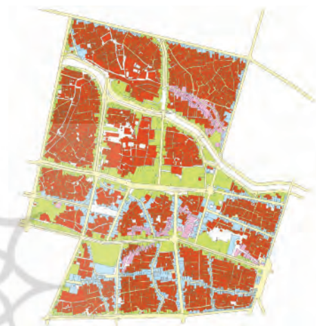
شکل ۲. دسترسی قطعات