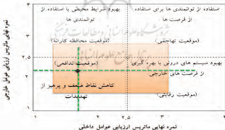
شکل ۹. ماتریس داخلی خارجی استقرار سامانه کاداستر چندمنظوره

از این استراتژی‌ها می‌توان نتیجه گرفت که پیاده‌سازی سیستم کارآمدی که بتوان در قالب مدل کاداستر چندمنظوره از مزایای آن در چارچوب توسعه زیرساخت‌های یکپارچه اطلاعاتی و با هدف به اشتراک گذاشتن اطلاعات در داخل کشور و یا در سراسر جهان بهره برد، ضروری است. بدین ترتیب قطعات ملکی از حالت انحصاری فیزیکی و ابعاد ثابت خارج می‌شوند و به عنوان عرضه‌ای با تمام ویژگی‌های قابل تغییر ارائه می‌گردند، و متعاقباً نوع برخورد و برنامه‌ریزی براساس این نگرش در میان کاربران متحول می‌شود و رویکرد جامع‌تر و انعطاف‌پذیرتری شکل می‌گیرد.