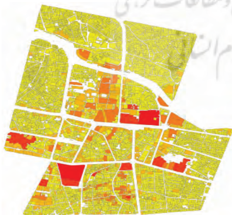
شکل ۵. ارزش معاملاتی املاک