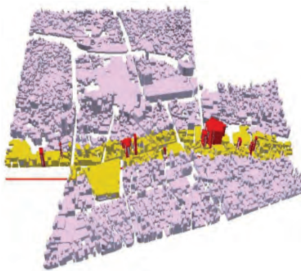
شکل ۷. وضعیت املاک واقع در حریم مترو