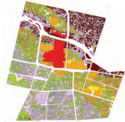
شکل ۶. آسیب‌پذیری قطعات ملکی