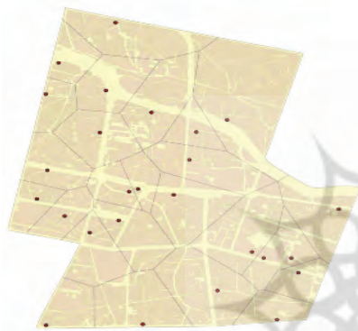
شکل ۳. خدمات‌رسانی تجهیزات شهری (Thiessen polygon)

ممکن است به‌منظور تحلیل دسترسی به خدمات عمومی، توابع مختلفی در GIS به کار گرفته شوند. این توابع و استفاده چندمنظوره از داده‌ها در قالب پایگاه داده‌های جغرافیایی برحسب موارد، که در ادامه ذکر می‌گردند، امکان تجزیه و تحلیل را برای همگان - از مالک تا خریدار، از برنامه‌ریز تا پیمانکار ساختمان، و نیز مدیران و متصدیان شهری و دیگر عناصر و مؤلفه‌های مرتبط با زمین - فراهم می‌سازند. مزیت اصلی این مدل