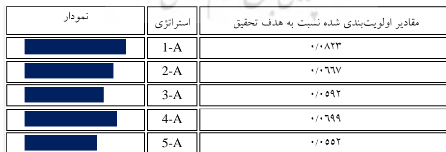
جدول ۵. اولویت استراتژی‌های توسعه‌ی گردشگری پایدار استان لرستان