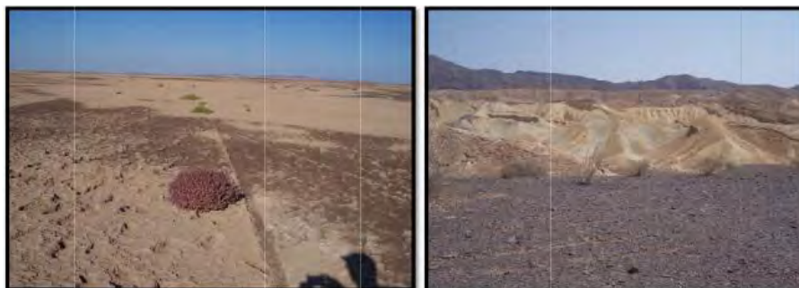
ج- سنگفرش بیابانی و چشم‌انداز کوهستانی بخش جنوبی منطقه د- جلگه‌ی رسی در حاشیه‌ی کویر