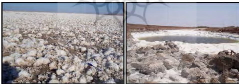
ب - شکوفه‌های نمکی در حاشیه‌ی کویر

چشم اندازه‌های ژئومورفولوژیکی پارک ملی کویر برای بهره‌گیری با تأکید بر عیارهای مدیریتی و ژئومورفولوژیکی و در مجموع بهره‌برداری با رویکرد گردشگری پایدار، نیازمند شناسایی خصوصیات ژئومورفولوژیکی آنهاست. این ژئومورفوسایت‌ها که از نظر موقعیت جغرافیایی در مناطق خشک تشکیل می‌شود، به دلیل تنوع مورفولوژیکی، دارای شرایط متنوعی در چگونگی شکل‌گیری عوارض هستند و همچنین جاذبه‌های نمونه‌ای در ارتباط با ارزش‌های آموزشی، گردشگری‌های علمی و تحقیقی برای محققین، جاذبه‌های تفریحی هستند (مانند سرخوردن از تپه‌های ماسه‌ای و...)، جاذبه‌های ورزشی (از قبیل دوچرخه سواری، اتومبیل‌رانی، شتر سواری، پیاده روی‌های استقامتی و مانند آن). این چشم اندازه‌های ژئومورفولوژیکی ویژه یا به اصطلاح ژئومورفوسایت که در مقاله‌ی حاضر با استفاده از مشاهدات میدانی ارزیابی شدند، شامل: جلگه‌ی رسی، نواحی ناهموار به‌ویژه سیاه کوه، پلیگون‌های نمکی یا کویرهای چندضلعی، سطوح پف کرده و شخم خورده، سنگ فرش‌های بیابانی، جزیره‌ی سرگردانی، رودخانه‌ی شور، شکوفه‌های نمکی می‌شود. در شکل شماره‌ی ۶ نمونه‌هایی از این ژئومورفوسایت‌ها دیده می‌شود (شکل-۶).