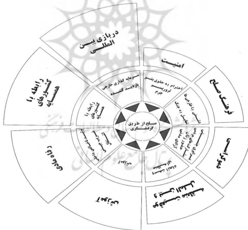
مدل پیشنهادی محقق صلح از طریق گردشگری

محقق با استفاده از نتایج به دست آمده در رابطه با چگونگی رسیدن به صلح از طریق گردشگری و میزان اثر توسعه‌ی گردشگری بر شاخص‌های جهانی صلح مدل زیر را ارائه داده است.