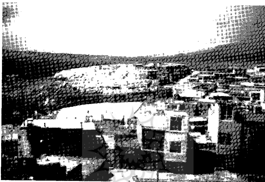
نمایی از محله‌ی دوخواهران (معبد در این جا قرار داشته است).

شمّ قوی سیاسی و با اقتدار و استبداد ضعف‌ها را جبران کند و حکام ولایاتِ مختلف را مطیع خود سازد آرامش نسبی ایجاد نماید.