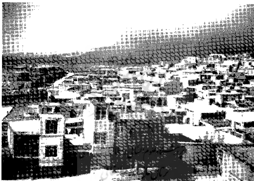
نمای دیگری از محلۀ دوخواهران نهاوند

۱- «انجمن نگین سبز» دوخواهران با هدف شناخت و معرفی و احیای موارث فرهنگی و رسیدگی به امور اجتماعی و رفاهی، آموزشی و ورزشی محلۀ دوخواهران فعالیت‌هایی را آغاز کرده است. آقای صالحی علاوه بر این مسئولیت، رابط انجمن دیگری به نام «انجمن امید» نیز هست. این انجمن زیر نظر بهزیستی شهرستان نهاوند در زمینه‌های فرهنگی، اجتماعی و آموزشی فعالیت دارد. امیدواریم در آینده شاهد به ثبوت رسیدن رسمی این «انجمن‌ها» و ارتقای کمی و کیفی آن‌ها در محلۀ دوخواهران باشیم و گزارش فعالیت‌های مستند آنان را به اطلاع خوانندگان فرهنگان برسانیم. «فرهنگان»