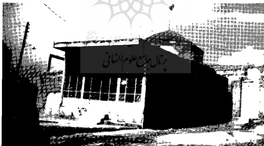
امامزاده دوخواهران

وجود امامزاده دوخواهران در این محله و انس و الفت دیرینه‌ی ساکنان با این مکان مقدس موجب تقویت ارادت و علاقه‌مندی آنان به اهل بیت (ع) شده است و وجه تسمیه‌ی این محله به نام «امامزاده دوخواهران»، حاکی از وجود چنین ارادت‌ی است. گفته می‌شود - البته جای تأمل و تحقیق دارد - این دو، دختران امام موسی بن جعفر (ع) و خواهران امام رضا (ع) هستند، که هنگام عبور آن حضرت (ع) از نهاوند، وفات یافته و در این محله مدفون شده‌اند.