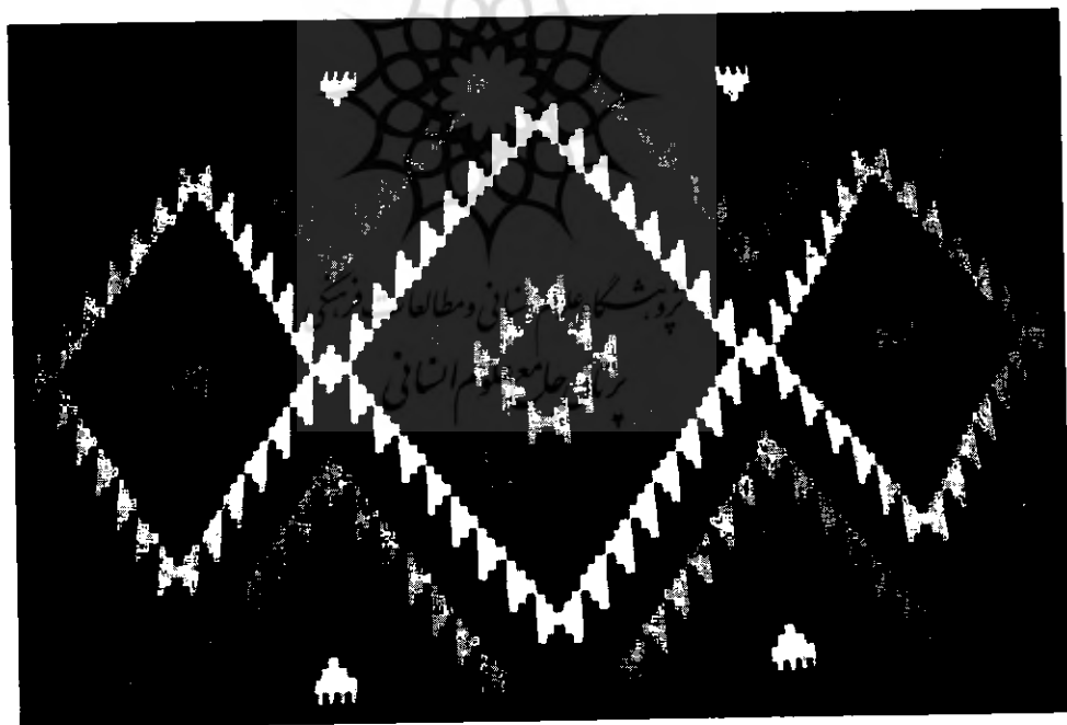
نمونه‌ای از گلیم بافت نهاوند

هم‌اکنون در شهرهای تهران، کاشان، تبریز، یزد، کرمان، زاهدان رشته‌ی فرش در دانشگاه دولتی دایر است و در نجف‌آباد اصفهان و چند جای دیگر دانشگاه آزاد اقدام به تأسیس کرده است. اما مشکل اساسی در این دانشگاه‌ها کمبود استاد است. هم‌چنین سرفصل‌ها هنوز به درستی مشخص نشده و کتاب‌های منبع کم داریم و استادان بیش‌تر سلیقه‌ای تدریس می‌کنند. مثلاً درباره‌ی درس «جغرافیای فرش ایران» که بسیار درس مهمی است کار جدی نشده است. این‌ها را مطرح کردم تا جوانب کار سنجیده شود. البته با گذشت زمان این رشته در سطح کشور ارتقای لازم را خواهد یافت و نهاوند در آینده می‌تواند با برنامه‌ریزی صحیح این رشته‌ی دانشگاهی را تأسیس نماید.