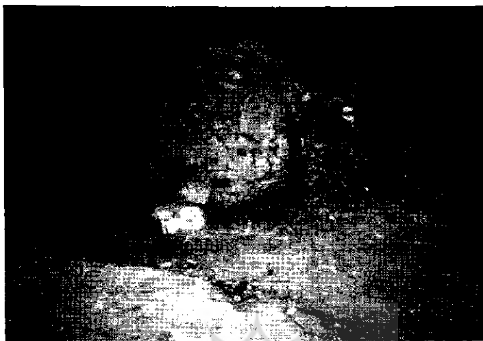
نمایی از دروودی یکی از یخچال‌های قدیمی و دیوار

با روی کار آمدن دستگاه‌های یخ‌سازی، مردم از کجا یخ تهیه می‌کردند؟ وقتی کارخانه‌ی یخ‌سازی مروتی درست شد، از این کارخانه یخ تهیه می‌کردیم. اما چون نیاز شهرمان را تأمین نمی‌کرد، ناگزیر می‌شدیم از خرم‌آباد، ملایر و گاهی از تهران یخ بیاوریم.