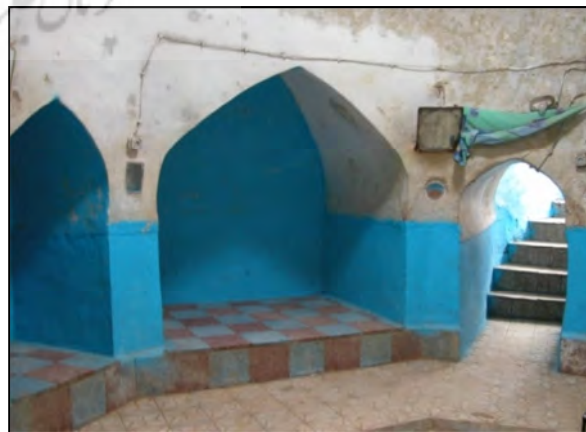
نگاره‌ی ۱ و ۲: جاذبه تاریخی - حمام سنگی مربوط به دوره‌ی قاجاریه در روستای چرمه‌ی علیا