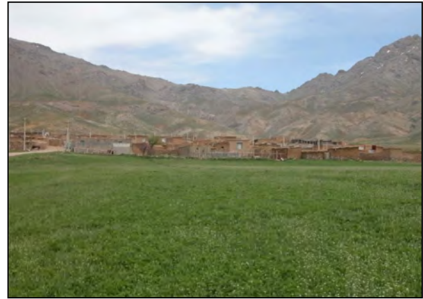
نگاره ۳ و ۴: نمایی از روستای چرمه علیا