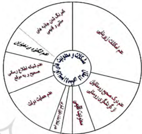
شکل ۴: مدل اقتضایی روستای چرم‌له علیا

نمود و تأیید نظر کارشناسان نیز باعث اعتبار مدل حاصله شد.