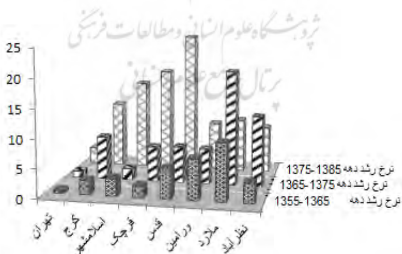
نمودار ۱: مقایسه نرخ رشد تهران و ۷ شهر بزرگ اطراف آن (درصد)