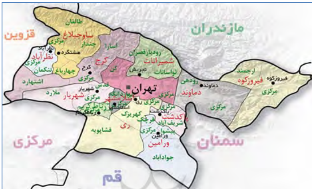
نقشه ۱: مجموعه شهری تهران، ۱۳۸۸.