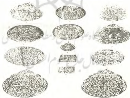
نقش مهر های پادشاهان صفوی

مُهر: رسم مهر کردن فرمان‌ها، از دیرباز در ایران معمول و شغل مهربرداری از مشاغل مورد احترام درباری بوده است، و سابقه‌ی آن به ایران باستان می‌رسد. ۱ پادشاهان عصر تمدن اسلامی در ایران نیز، همان‌گونه که مورخین و سیاحان بخصوص شاردن در آثار خود آورده‌اند؛ هر کدام دارای چندین مهر با اندازه، اشکال، جنس‌های متفاوت و هر کدام با توجه به ویژگی که داشتند در فرمانی خاص به کار می‌رفتند. به عنوان نمونه، کلیه‌ی امور دیوان ممالک از قبیل عهدنامه و مکاتبات با خارجیین و احکام اجازه‌نامه با مهری هلالی شکل از جنس فیروزه مهور می‌شد. اموری که مربوط به نظام بود و احکامی که از اداره‌ی خاصه صادر می‌گردید با مهرمربع شکل مهر می‌شد. مهر مربوط به امور مالی و خالصه و انتصابات دستگاه خاصه و امور سپاه با مهری از جنس یاقوت و مربع شکل مهور می‌شد. این مهر، از اقسام مهرهای دیگر مهم‌تر بود. مهر مدور شکل، بیشتر در امور موقوفات و انتصاب صدور تولیت مورد استفاده قرار می‌گرفت. ۲ در اعتبار بخشی به اسناد و نامه‌های رسمی نقش مهر مهم‌ترین رکن فرمان در طول تاریخ به شمار می‌آمده که با شکل‌های متنوع خود جلوه و نمای خاصی به فرمان‌ها می‌داده است. محل مهر، تا قبل از شاهان قراقویونلو و آق‌قویونلو در پایین مهر یا حواشی فرمان بوده، و از زمان تیموریان در سمت بالای فرمان جای گرفته است.