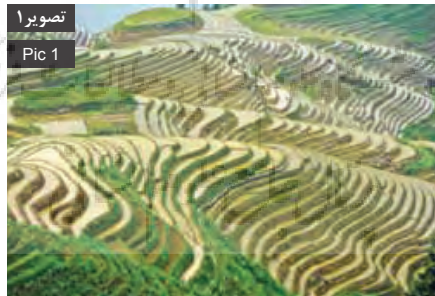
تصویر ۱ Pic 1