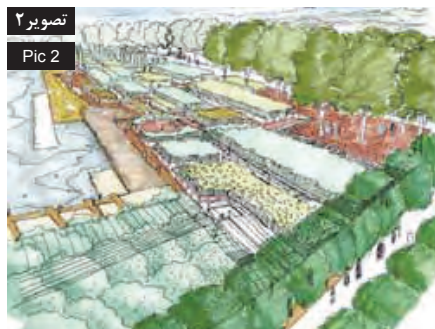
تصویر ۲ Pic 2

فهم مدیریت از نقش رودخانه در احیای هویت شهر ◀ به دنبال رشد صنعتی شانگهای در اوایل قرن ۲۰، ریزش پساب‌های صنعتی کارخانه‌ها و مجتمع‌های صنعتی در رودخانه هونگپو (Huangpu) یکی از عوامل اصلی آلودگی آب به شمار می‌رفت. علاوه بر این با انتقال کارخانه‌ها به سایت‌های صنعتی واقع در حاشیه شهر، ساحل رودخانه، محل دفن زباله‌های شهری و صنعتی شد که این امر نیز در افزایش آلودگی آن مؤثر بود. آلودگی زیاد رودخانه و عدم وجود دسترسی مناسب به آن، این رگ حیاتی را به مکانی مرده و منزوی و خالی از هرگونه زندگی اجتماعی تبدیل کرد. مسئولان شهری شانگهای آگاه بودند که این رودخانه همچون یک رگ حیاتی مهم سال‌هاست که در کالبد شهر جریان دارد. راهکارهایی همچون از بین بردن و پوشاندن رودخانه نه تنها کمکی به رفع مشکلات نخواهد کرد بلکه بخش مهمی از طبیعت و هویت شهر را نیز از بین خواهد برد.