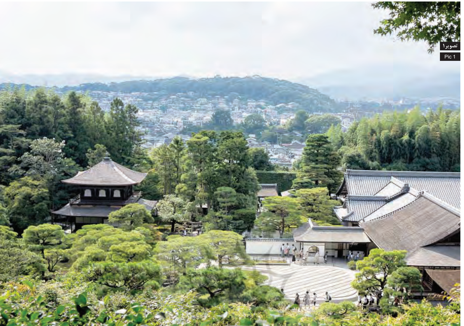
تصویر ۱ Pic 1