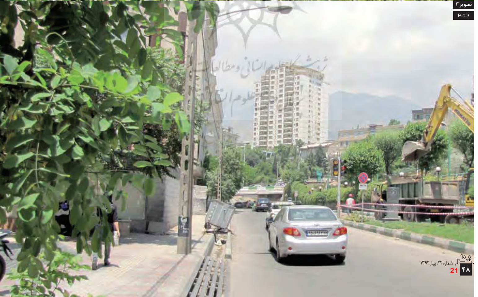
تصویر ۳ Pic 3