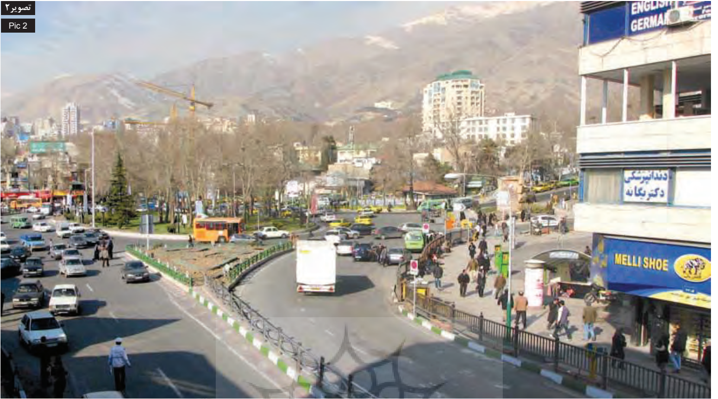
تصویر ۲ Pic 2