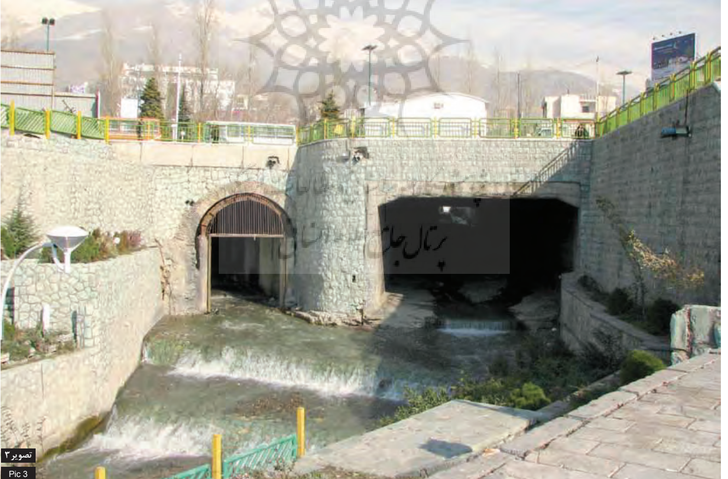
تصویر ۳ Pic 3