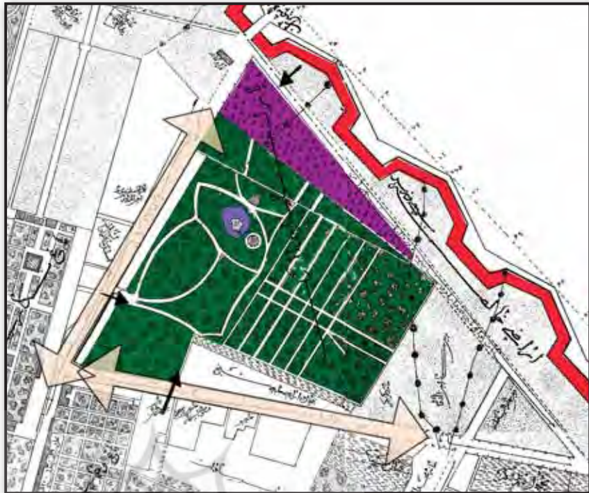
Fig. 1. Amin-o-Dolleh Park in Tehran's old map and roads leading to it. Source: authors, based on Najm- ol molk map.

تصویر ۱. نقشه پارک امین‌الدوله و دسترسی‌های آن در سال ۱۳۰۹ ق. مأخذ: نگارندگان با بهره‌گیری از نقشه پایه نجم‌الملک منتشره به سال ۱۳۰۹ ه.ق.