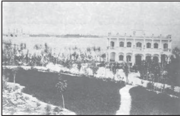
تصویر ۳. پارک امین‌الدوله، کاشت چمن در محل دریاچه، تصویر مربوط به اواخر دوره قاجار. Fig. 3. The main kiosk and lake of Amin-o-Dolleh, end of Qajar era.

از طرف دیگر، همان‌طور که در تصویر ۶ مشخص شده، در سال‌های بعدی نیز این دیوار حفظ شده بود و از این رو پارک