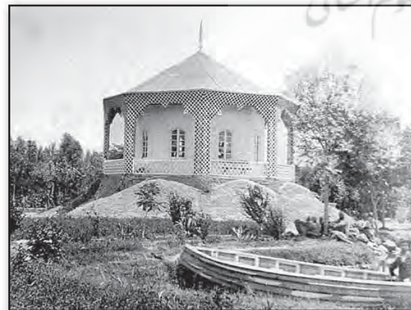
تصویر ۵. کلاه فرنگی چوبی پارک امین‌الدوله و قایق‌های دریاچه، تصویر مربوط به دوران ناصر. Fig. 5. The Kolahfarangi building of Amin-o-Dolleh Park, Nasser al din shah, era.

(کسروی، ۱۳۶۳: ۶۳۷)، که سردر بر جای مانده در خیابان شهید مشکی، ورودی به این تاکستان بوده است (تصویر ۲).