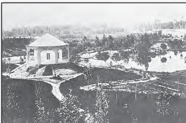
تصویر ۹. عکس از محوطه پارک، نظام خاص کاشت درختان در این پارک را نشان می‌دهد، تصویر مربوط به دوران ناصری.