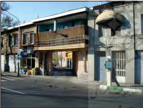
تصویر ۲. ورودی از پارک به تاکستان. عکس: ابوزر مجلسی کویپای، ۱۳۹۰. Fig. 2. A present picture of the northern entrance of Amin-o-Dolleh Park. Photo by: Abouzar Majlessi Koupaei, 2011.

محل قراردادن دوربین از روی نقشه قدیمی نجم‌الملک و نیز مطالعه اسناد و خاطرات افراد مختلف، می‌توان به نکات مهم در مورد آن دست یافت: