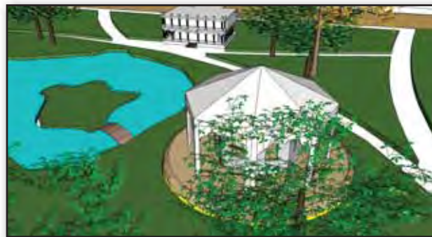
تصویر ۸. تصویری بازسازی شده از ساختمان کوشک بیرونی و نیز کلاه‌فرنگی پارک امین‌الدوله.