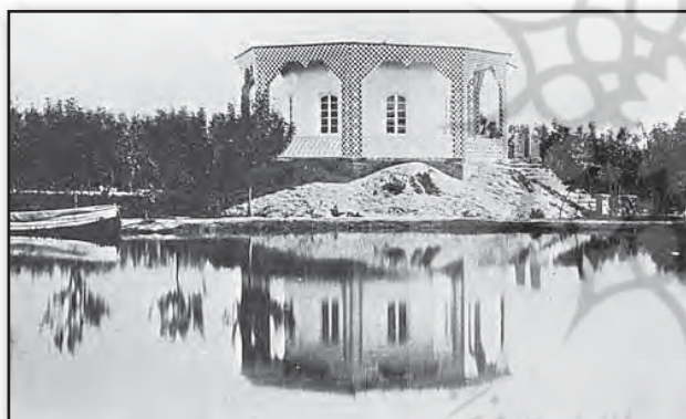
تصویر ۷. عمارت کلاه‌فرنگی پارک بر روی تپه دست‌ساز، تصویر مربوط به دوران ناصری.

۷. آن‌طور که از نوشته‌های اعتمادالسلطنه نیز برمی‌آید، امین‌الدوله از پارک به عنوان محل سکونت استفاده نمی‌کرده است (اعتمادالسلطنه، ۱۳۸۵: ۲۹۹) و بنای واقع در پارک به عنوان بیرونی مورد استفاده قرار می‌گرفته است (همان: ۲۲۸)، این بنا به همراه پارک خود نوعی دفتر کار محسوب می‌شده و گاهی جلسات مهم دولتی نیز در آن برگزار می‌شده است، کما اینکه در جلسه‌ای که به سال ۱۲۹۷ ه.ق در پارک برگزار شده بود درباره عزل