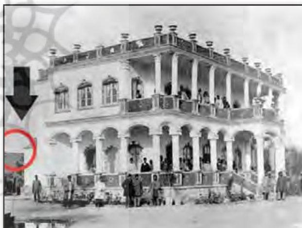
تصویر ۶. دیوار حصار پارک امین‌الدوله در تصویر مشخص شده - تصویر مربوط به دوران متاخرتر از ورود مشروطه خواهان به پارک است.