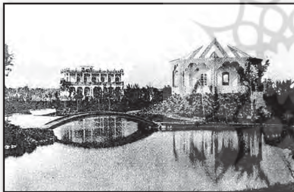
تصویر ۴. دریاچه، جزیره و کلاه فرنگی و کوشک پارک امین‌الدوله، تصویر مربوط به دوران ناصر. Fig. 4. The main kiosk and lake and the Kolahfarangi building related to the park, Nasser al din shah, era.