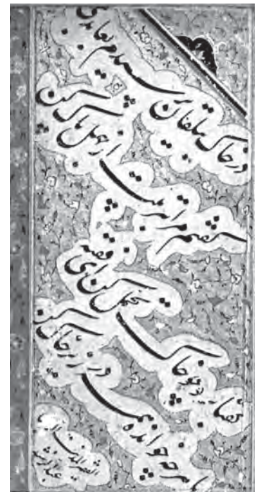
تصویر ۶ - قطعه (تک برگ)

به دعاگویی دولت ابدقرین مشغول باشد و سایه آن کعبه حاجات بر سر بندها گسترده باد». (لاهوری، ۱۹۶۷، ۲۶۹ - هفت قلمی، ۱۳۷۷، ۲۷۶)