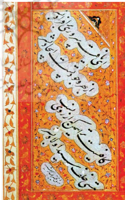
تصویر ۵- قطعه (تک برگ)