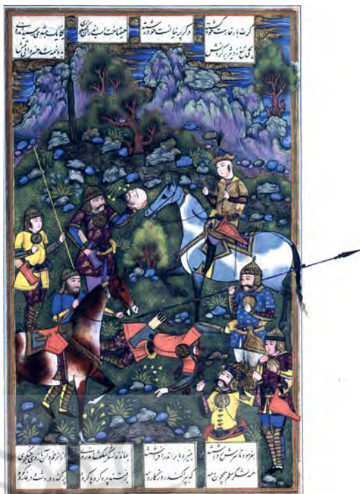
تصویر ۴- مجلس پنجم، کشته شدن سلم به دست منوچهر، شاهنامه رشیدا،