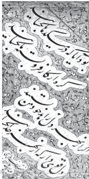
تصویر ۷ - قطعه (تک برگ)