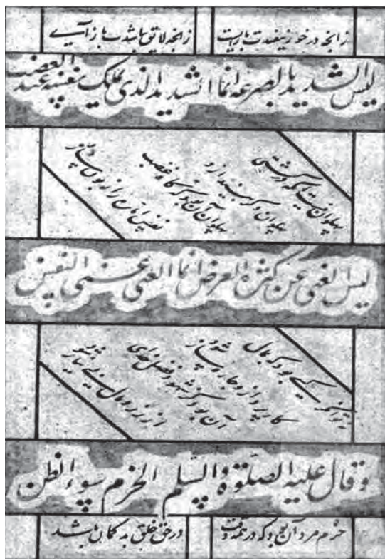
تصویر ۱۰- چهل کلمه، کتابت عبدالرشید دیلمی، ماخذ: بخش نسخ خطی کاخ موزه گلستان