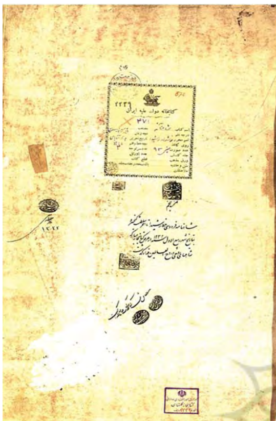
تصویر ۱- صفحه آستر بدرقه شاهنامه رشیدا، ماخذ: بخش نسخ خطی، کاخ موزه گلستان

نسخه خطی شاهنامه رشیدا با شماره ۲۲۳۹ در کتابخانه کاخ موزه گلستان نگهداری می‌شود. این نسخه متعلق به سده یازدهم هـ.ق و به احتمال زیاد در کارگاه سلطنتی در اصفهان