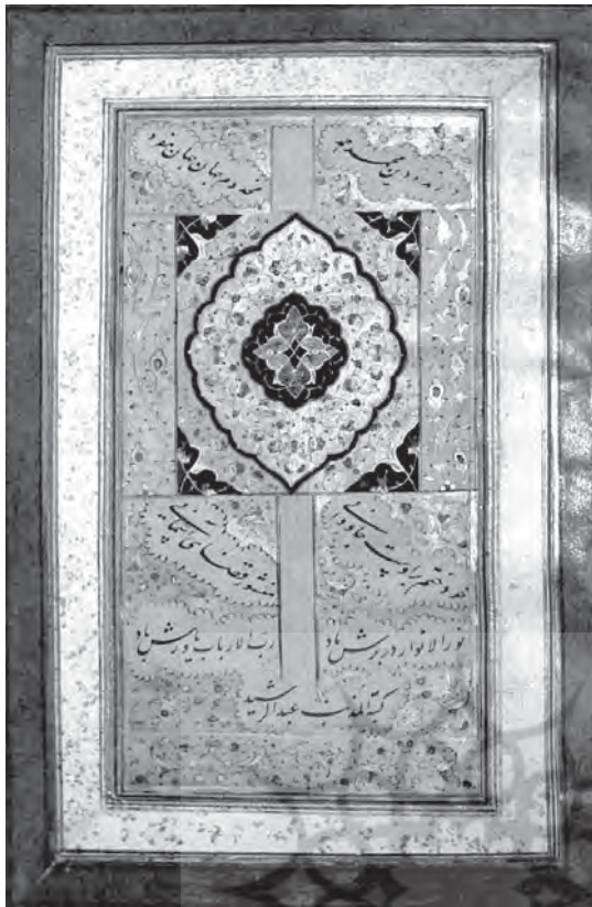
تصویر ۱۳ - تحفه العراقین، کتابت عبدالرشید دیلمی، ماخذ: بخش نسخ خطی، کاخ موزه گلستان