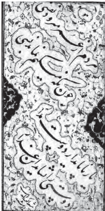
تصویر ۸ - قطعه (تک برگ)