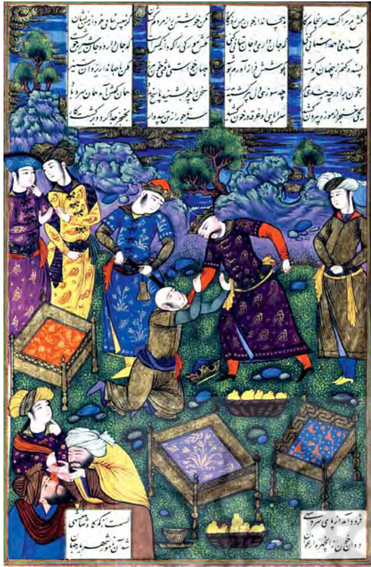
تصویر ۳- مجلس سوم، کشته شدن ایرج به دست برادران، شاهنامه رشیدا، ماخذ: کاخ موزه گلستان