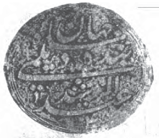
تصویر ۱۴- مَهر عبدالرشید دیلمی، بنده شاه جهان عبدالرشید دیلمی، در کتاب مفاتیح الاعجاز، ماخذ: بخش نسخ خطی، کاخ موزه گلستان

آثار را نشان می‌دهد. این روش تطبیقی، به چگونگی اجزا و شکل‌های به‌کار رفته در اثر هنری می‌پردازد. در تمامی ادوار رسم الخط فارسی، هر یک از کاتبان برای نوشتن برخی از حروف و کلمات علائم خاصی به‌کار برده‌اند که با کاتبان دیگر تفاوت دارد. مقایسه رسم الخط شاهنامه رشیدا با چهل کلمه، تحفه‌العراقین و قطعات عبدالرشید نشان می‌دهد که رسم الخط این نسخه با سایر آثار قلم رشیدا متفاوت است. برای نتیجه‌گیری از این مقایسه علاوه بر شرح تفاوت شکل حروف مفرد خوشنویسی شاهنامه نمونه‌های رقم‌دار عبدالرشید و نظرات تخصصی اساتید هنر خوشنویسی مانند (غلام حسین امیرخانی، عباس اخوین، علی واشقانی، فتحعلی واشقانی و مجتبی سبزه) نیز در قالب جداولی برای نتیجه بهتر ارائه می‌گردد. (جدول ۲)