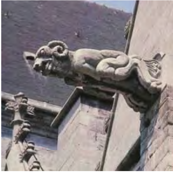
تصویر (۶): گرگویل قوج، دانشکده کلیسای وودرو، بلژیک.

هستند. گرگویل‌ها را می‌توان براساس ظاهرشان به گروه‌های زیر تقسیم نمود: