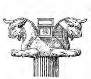
تصویر (۱۷): سر ستون شیر شاخ دار پشت به پشت، تخت جمشید.