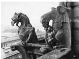
تصویر (۷): گرگویل پرنده، کلیسای نوتردام، پاریس

تعداد گرگویل‌های انسانی اگرچه به اندازه گرگویل‌های حیوانی نیستند، اما بسیار متنوع و از لحاظ آناتومی و ظاهر بیشتر عجیب هستند تا زیبا و قابل تمجید. ویژگی ناقص آنها