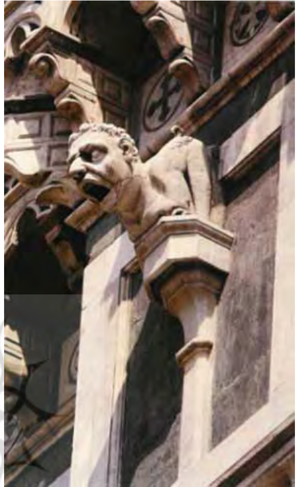
تصویر (۱۱): گرگویل "انسان-حیوان"، ضلع جنوبی کلیسای سانتا ماریا.

می توان سه نوع رایج ترگراین من را به صورت زیر طبقه بندی نمود: