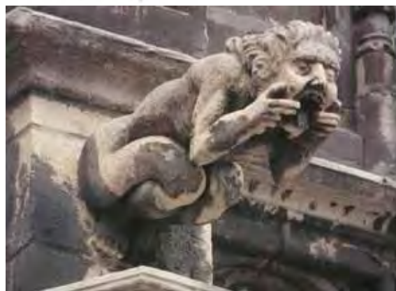
تصویر (۹): گرگویل انسانی، شهرداری بروسلز.

زبانی بیرون آمده می تواند به عنوان نمادی از خائنان، بدعت گذاران و کافران باشد و نیز ممکن است چون نمادی از "امتناع"، موظف به دور نگاه داشتن اهریمن باشد (تصویر ۹). هنرمندان قرون وسطی گاهی شیطان را در حال زبان درازی به قربانیانش (به منظور ریشخند کردن آنها) نشان می دادند.