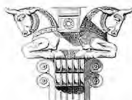
تصویر (۱۵): طرح سرستون تخت جمشید و قرارگیری تیرهای حامل سقف، طراحی بوسیله اوژن فلاندن.

این گرگویل ها را می توانیم به نام ترکیبات "حیوان-حیوان" بنامیم. یکی از انواع مشهور آن گریفین یا شیر دال است که ترکیبی از سر شیر و بدن عقاب می باشد. عناصر معماری به اشکال مختلف حیوانات تخیلی و واقعی، علاوه بر استفاده عملی، دارای مفاهیم نمادین نیز می باشند.