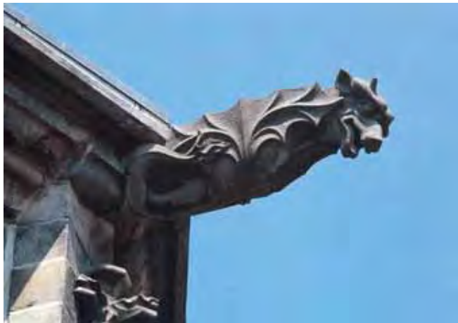
تصویر (۱۴): گرگویل "حیوان-حیوان"، کلیسای دانشگاهی سنت وادرو، مونز بلژیک

در اوستا آمده است که میترا در رفیع ترین آسمان ها در کاخ