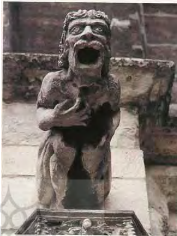
تصویر (۸): مرد زمزمه گر، شهرداری بروسلز