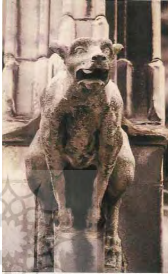
تصویر (۴): گرگویل سگ، کلیسای سنت اربین، فرانسه.

عقیده بر این بود که شیاطین یا می ترسیدند و می گریختند، و یا با فرض اینکه که موجودات اهریمنی حضور دارند دیگر به ساختمان ها حمله نمی کردند. این می تواند یکی از دلایلی باشد که چرا گرگویل ها کمتر زیبا، و بیشتر ترسناک هستند. آنها می توانند نوعی مترسک مقدس برای ترساندن اهریمن نیز باشند. (Benton, 1997: ۲۴) فرانسیس بیلینق تاریخ دان معماری انگلیسی، مفهوم گرگویل را به عنوان یک چیرگی نمادین و اصلاح توسط کلیسا، حتی در هیولایی ترین شکل های اهریمنی، فرض می کند. در هر صورت گرگویل ها، به عنوان یک نماد مورد استفاده قرار می گرفتند و به روش های متفاوتی تفسیر می شدند. آنها نمایانگر ارواح محکوم به گناه می باشند که ورود به کلیسا برایشان مهم بود و با اینکه از هلاکت ابدی رهایی پیدا کرده بودند اما با این حال جزای گناه آنها تبدیل شدن به سنگ بود. (ibid:25)