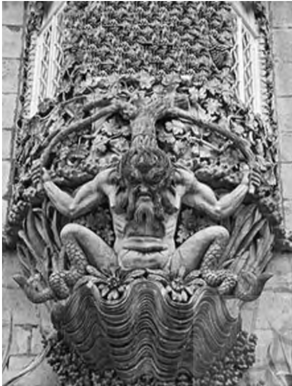
تصویر (۱۰): گرین من با پایهای مارگون