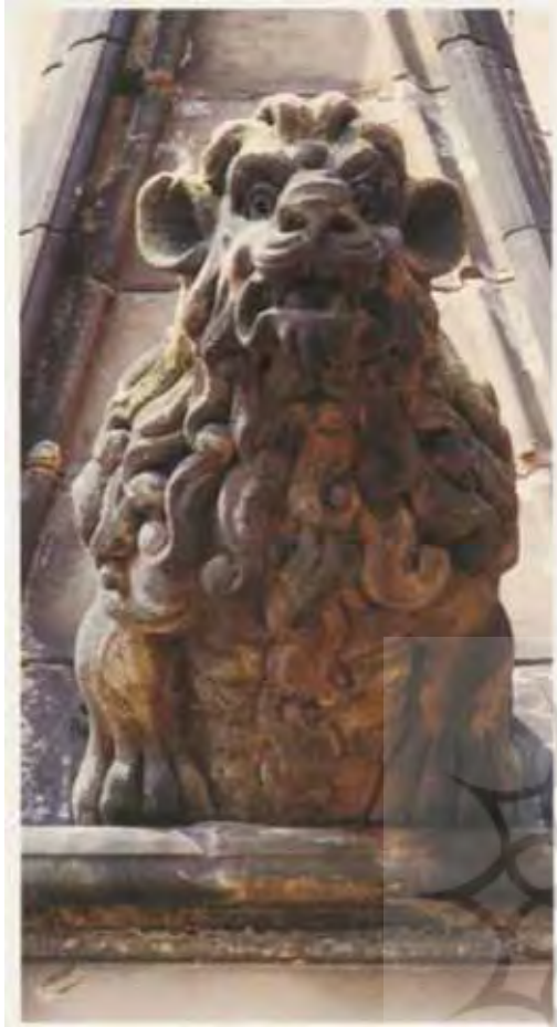
تصویر (۵): گرگویل شیر، کلیسای لچفیلد، انگلستان.