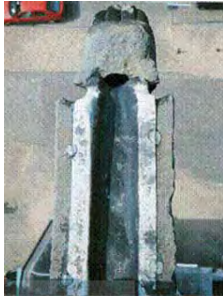
تصویر (۱): سیستم دفع آب باران از سقف توسط گرگویل، کلیسای آمین، فرانسه.

بیرون می ریزد. (تصویر ۱) واژه "گرگویل" (gargoyle) از لغت فرانسوی gargouille اقتباس شده که به معنای گلو یا مری است. معادل های لاتین gula و gurgulio، کلمات مشابه مشتق شده از ریشه gar، به معنای بلعیدن هستند که بیانگر صدای غل غل آب می باشد. (American Heritage, 2000: ۷۲۵)