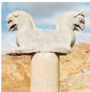
تصویر (۱۹): سر ستون به شکل گریفون های پشت به پشت.