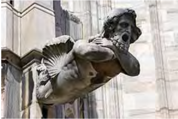
تصویر (۱۲): تریتون (موجود دریائی)، کلیسای سانتا ماریا، میلان.