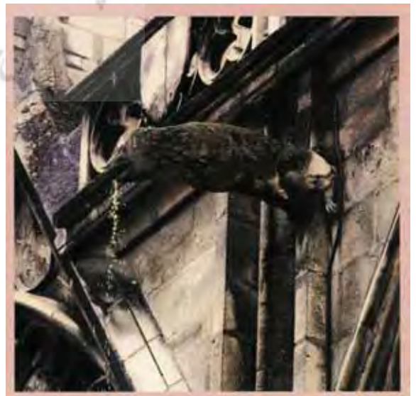
تصویر (۳): گرگویل حیوانی، کلیسای جدید دلف، هلند.

زمانی که بی سواد یک حقیقت جهانی و اعتقاد یک بحث تحت اللفظی بود، هدف بیشتر مجسمه های کلیسایی، غیر تزئینی و آموزنده بود. هدف این بود که تماشاگر را بترساند.