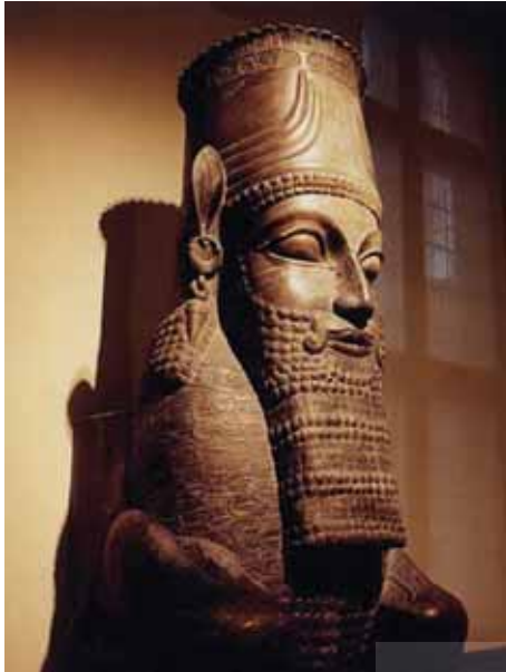
تصویر (۱۸): لاماسو، سر ستون ترکیب "انسان-حیوان"، ایوان شمالی کاخ صد ستون، موزه دانشگاه شیکاگو.