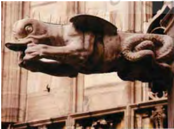
تصویر (۱۳): گرگویل "حیوان-حیوان" با ترکیب پیچیده، کلیسای جامع، میلان.

این گرگویل ها از ترکیب "نیمی انسان- نیمی حیوان" بوجود آمده اند. گرگویل کلیسای سانتا ماریا در فلورانس با سر انسانی که به بدن مختصر شده یک حیوان وصل شده (تصویر ۱۱)، یا گرگویلی شامل سر و بدن انسان و دم ماهی بجای پا، به شکل پری دریایی (تصویر ۱۲) از نمونه های این گروه می باشند. در این گروه، برخی از گرگویل ها دارای ترکیبات پیچیده تری هستند؛ در کلیسای جامع میلان گرگویلی با سر اردک، نیم تنه و بازوهای انسان و دم سوسمار، موجودی عجیب الخلقه را که قادر به زندگی در زمین، آسمان و دریا می باشد پدید آورده که بازگو کننده اوج تخیل انسان می باشد (تصویر ۱۳). (Benton, 1997:122)