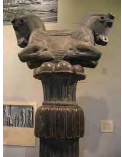
تصویر (۱۶): سر ستون گاو پشت به پشت، موزه دانشگاه شیکاگو.

در نتیجه ی این گروه بندی سر ستون های تخت جمشید به دو دسته تقسیم می شوند: